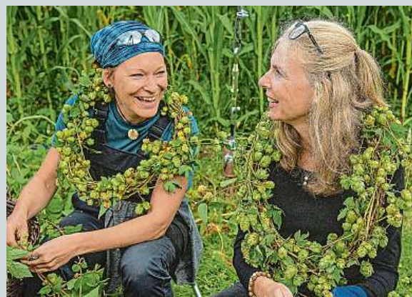
Chmelobraní. Studenti si uvaří vlastní pivo.