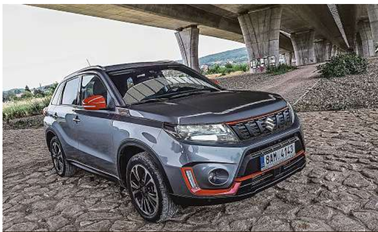
Tady není třeba něco výrazně měnit: Suzuki Vitara působí dravým dojmem.