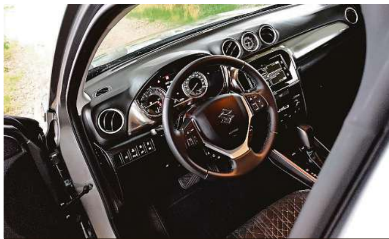
Interiér by chtěl omladit. Mechanická tlačítka ale mají stále fanoušky. 3x METRO

Má skvělý nový motor, dobře vypadá a ještě líp jezdí. A nestojí milion. Je to ideální auto?