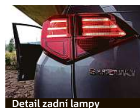
Detail zadní lampy

Protože Suzuki navýšilo napětí na čtyřnásobek oproti konvenčním 12 V, mildhybridní systém rekuperuje na brzdách více energie. Řídicí jednotka zvolí vhodný režim zapojení elektromotoru podle toho, jak akcelerujete: zda pomůže při akceleraci a zahladí turboefekt, nebo spalovacímu motoru navýší točivý moment. Anebo bude udržovat volnoběžné otáčky při brzdění. U toho se pak zbytečně nespálují benzin. Pro úplnost dodejme, že na turbo sa-