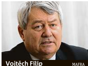
Vojtěch Filip

pírá, snaží se jen zpochybnit vyšší částky. Filip odmítá, že by uvedené peníze dostal. Předseda komunistů už dříve uvedl, že se nedopustil ničeho nezákonného a příjmy má v pořádku. Případem se zabývá i finanční správa (viz box).