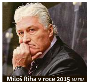
Miloš Říha v roce 2015

„Je to pro nás všechny nepopsatelný šok, že nám odešel tak velký a skvělý člověk a obrovský srdcař,“ uvedl pro