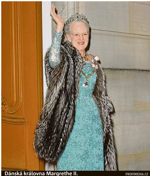
Dánská královna Margrethe II.

Souvisí to především s tím, že hraběnka Alexandra, bývalá manželka druhorozeného syna dánské královny Joachima, se své apanáže dobrovolně vzdala. Učinila tak poté, co její nejmladší syn Felix, kterého má s Joachimem, dosáhl letos v červenci věku osmnácti let.