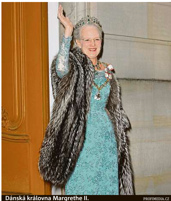
Dánská královna Margrethe II.

Souvisí to především s tím, že hraběnka Alexandra, bývalá manželka druhorozeného syna dánské královny Joachima, se své apanáže dobrovolně vzdala. Učinila tak poté, co její nejmladší syn Felix, kterého má s Joachimem, dosáhl letos v červenci věku osmnácti let. ČTK a MET