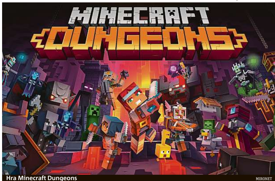
Hra Minecraft Dungeons

Vydat se na dobrodružnou výpravu s kamarády je snem, který by si přál splnit kdekdo. Vzhledem k tomu, že prokletých dungeonů, plných pokladů, nestvůr a nebohých vesničanů, které utiskuje prašivý zloduch, na světě moc nenajdete, musíte tato dobrodružství hledat ve světě virtuálním.