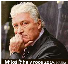
Miloš Říha v roce 2015

„Je to pro nás všechny nepopsatelný šok, že nám odešel tak velký a skvělý člověk a obrovský srdcař,“ uvedl pro