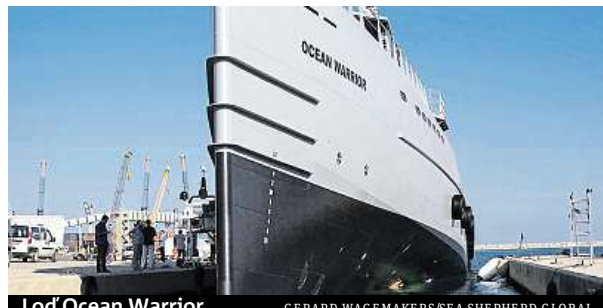
Loď Ocean Warrior

Nové plavidlo se jmenuje Ocean Warrior (Válečník oceánu). Je 54 metrů dlouhý a má výtlač 439 tun. Dokáže plout rychlostí až 25 uzlů (asi