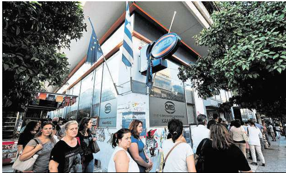
Nejhorší situace je v Řecku.