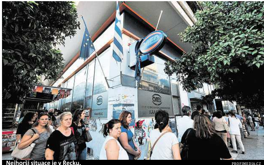
Nejhorší situace je v Řecku.