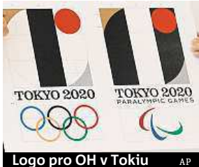
Logo pro OH v Tokiu

Pořadatelé olympijských her v Tokiu 2020 budou vybírat nové oficiální logo. To původně představili v červenci, hned po jeho prezentaci ale byli obviněni z plagiátorství. Nyní se objevily v médiích další informace, podle nichž designér Kenziro Sanó použil pro svou práci materiály zkopírované z internetu. Organizační výbor se proto rozhodl vyhlásit novou soutěž. Pochybnosti o logu rozpoutal belgický designér Olivier De-