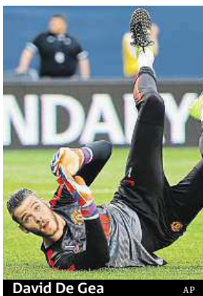
David De Gea

Celé pondělí probíhalo jednání mezi oběma velkokluby. Podle desetibodového prohlášení Realu zaslal madridský klub do Anglie všechny potřebné dokumenty krátce po poledni. Odpověď s připomínkami přišla až po osmi hodinách. Přesto ještě byl čas