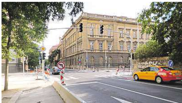
Nové semaforey už dirigují dopravu na magistrále.

„Světelné signalizační zařízení je kompletně dokončeno a proběhly zkoušky. Uskutečnilo se také místní šetření,