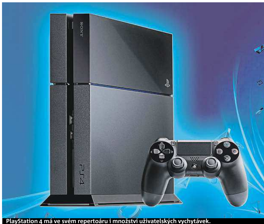
PlayStation 4 má ve svém repertoáru i množství uživatelských vychytávek.

Představte si, že si chcete z oficiálního on-line obchodu stáhnout hru, ale nechce se vám čekat, až stahování konečně doběhne. Díky funkci