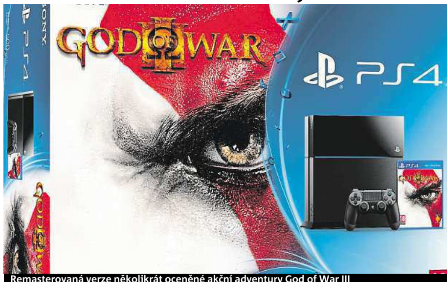
Remasterovaná verze několikrát oceněné akční adventury God of War III

Jestliže se doma najde někdo, kdo nerozumí vaší potřebě