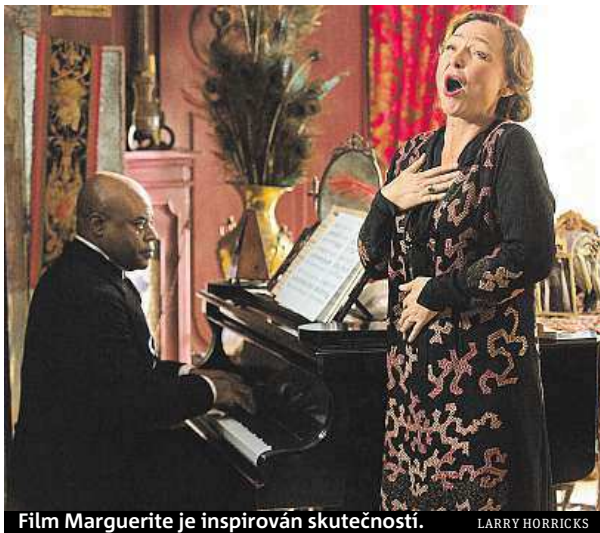
Film Marguerite je inspirován skutečností.

Toto drama ale není mezi jedenadvaceti snímky, které mají šanci 12. září získat Zlatého lva, hlavní festivalovou cenu pro nejlepší film. V Benátkách se dále hraje o režisérského Stříbrného lva, Velkou cenu poroty nebo Volpi-