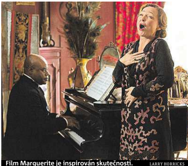
Film Marguerite je inspirován skutečností.

Toto drama ale není mezi jedenadvaceti snímky, které mají šanci 12. září získat Zlatého lva, hlavní festivalovou cenu pro nejlepší film. V Benátkách se dále hraje o režisérského Stříbrného lva, Velkou cenu poroty nebo Volpi-