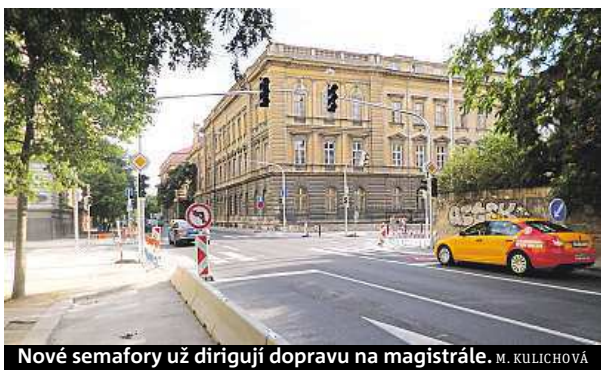
Nové semaforey už diriguji dopravu na magistrále. M. KULICHOVÁ

Termínů, kdy se otevře tunelový komplex Blanka v Praze, už tu bylo mnoho. Ale tentokrát to podle všeho magistrátu a stavebním firmám opravdu vyjde. „Tunel otevíráme, všechny přípravy probíhají