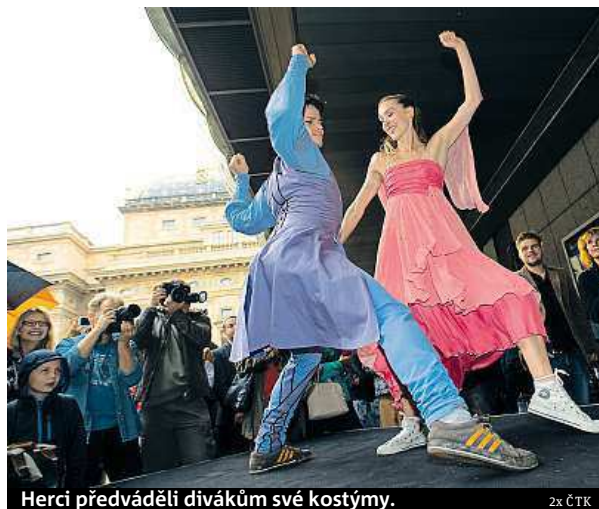
Herci předváděli divákům své kostýmy.