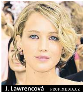
J. Lawrenceová

Neznámý hacker ukradl choulostivé fotografie asi stovky převážně amerických filmových celebrit a v noci na pondělí je uveřejnil na internetu. Například herečka Jennifer Lawrence už pohrozila žalobou každému, kdo bude její fotografie dále sdílet. Hvězda,