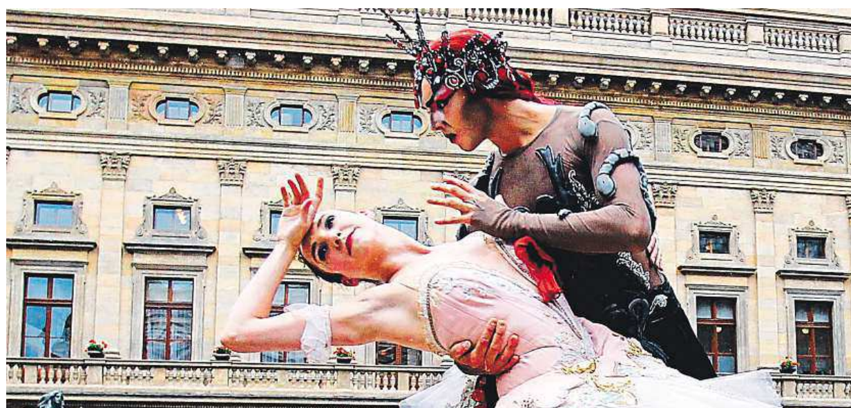
Módní přehlídkou kostýmů z inscenací zahájili umělci Národního divadla v Praze novou sezonu. Více na straně 11

Možná v roce 2015. Nový pilotní systém parkovacích zón v Praze měl fungovat od včera, ale odkládá se na první čtvrtletí příštího roku. Novinky. Plánují se smíšené zóny a lokální parkovací karty STRANA 2