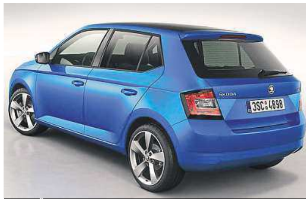
Nová Škoda Fabia

lů chystá dál rozšiřovat. „Za skutečně významný a důležitý považují fakt, že se jedná o úplně nové zákazníky, kteří dosud u naší značky nebyli,“ podotkl. ČTK