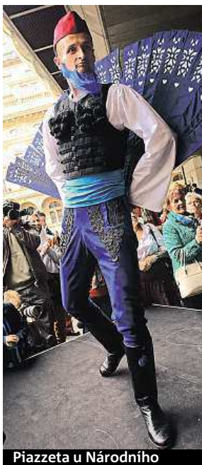
Piazzeta u Národního

Další ukázky patřily operním představením Příhody lišky Bystroušky, Prodaná nevěsta, Čert a Káča, Jakobín i čino-