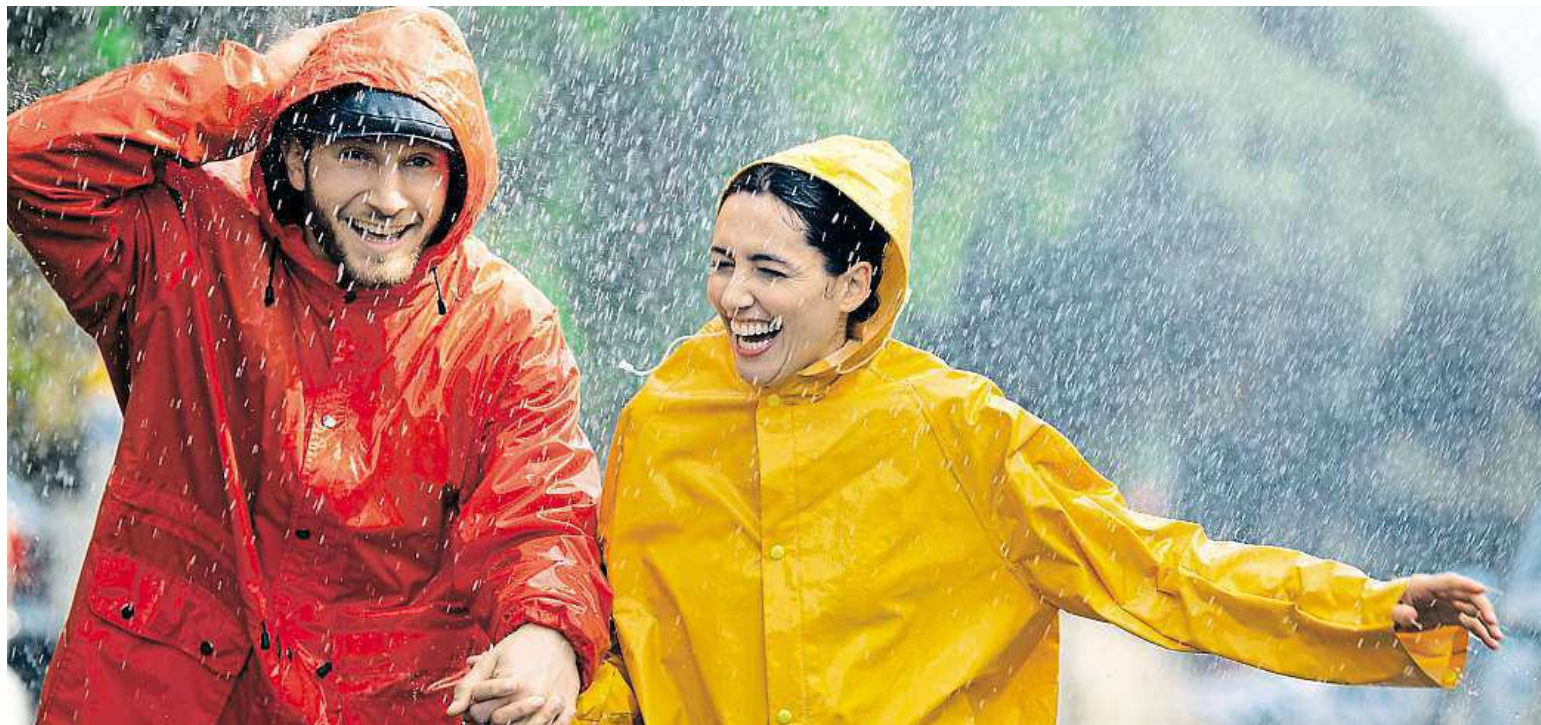
Only on Earth does fresh water fall from the sky to sustain life.