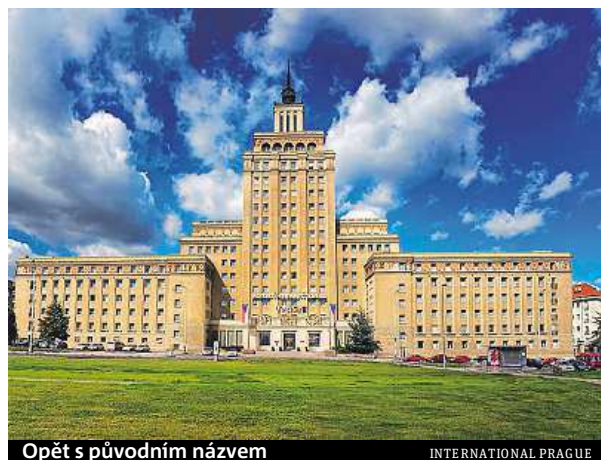
Opět s původním názvem

Hotel měnil během let jména poměrně často, a to nejen kvůli filmarům, v minulosti nesl jména Družba, Čedok, Holiday Inn a naposledy Crown Plaza. ROW, BEL