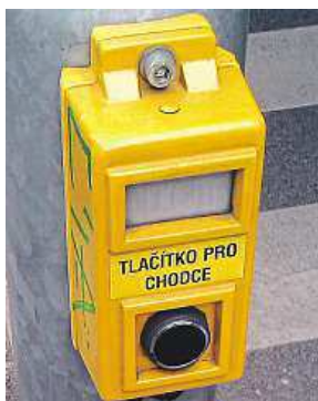
Možnosti volby na náměstí Míru v Praze 2

„Jak ale fungují tlačítka pro nevidomé, když na ně slepci nevidí?“ zaznívá opakovaně dotaz od čtenářů. Technická správa komunikací,