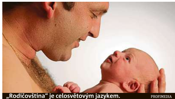
„Rodičovština“ je celosvětovým jazykem.

Hiltonové pomáhalo více než 40 vědců, kteří shromáždili a analyzovali 1615 hlasových nahrávek od 410 rodičů ze šesti kontinentů v 18 jazycích z různých komunit: venkovských i městských, izolovaných i kosmopolitních, při-