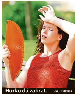
Horko dá zabrat.

Pokud si budete chtít vzduch ochladit více, riskujete zdravotní následky. Tělo totiž velké teplotní výkyvy