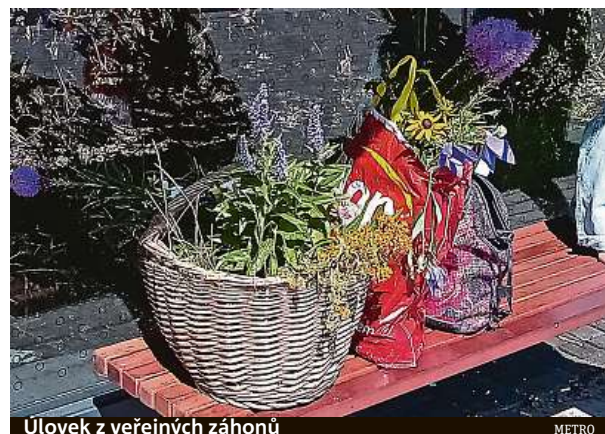
Úlovek z veřejných záhonů