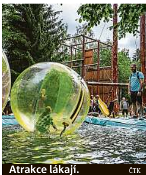
Atrakce lákají.

V Moravskoslezském kraji si letní sezonu zatím spíše pochvalují. S průběhem prázdnin jsou spokojeni například v Autokempu Olešná a na Frýdku-Místku. Areál se nachází zhruba 20 kilometrů od Ostravy v rekreační zóně přehrady Olešná na úpatí Palkovických hůrek s výhledem na Beskydy. Plocha stanoviště pro karavany je zhruba čtyři tisíce metrů čtverečních a nabízí přibližně třicet míst vybavených elektrickými přípojkami. „Ví-