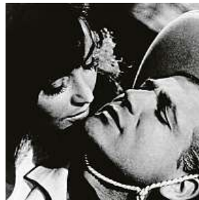
Limonádový Joe 2x PROFIMEDIA

Lipský se narodil v Pelhřimově. Jeho otec Vilém měl ve městě cukrárnu s kavárnou a rovněž vedl místní ochotnický spolek. Oldřich, stejně jako jeho starší bratr Lubomír, pozdější slavný herec, zde získali první divadelní zkušenosti. K filmové režii se Lipský dostával postupně. Jeho první kontakt s filmem byl v roce 1945 po odchodu do Prahy, kde studoval práva a filozofii. Zde při natáčení Krškova filmu Kluci na řece