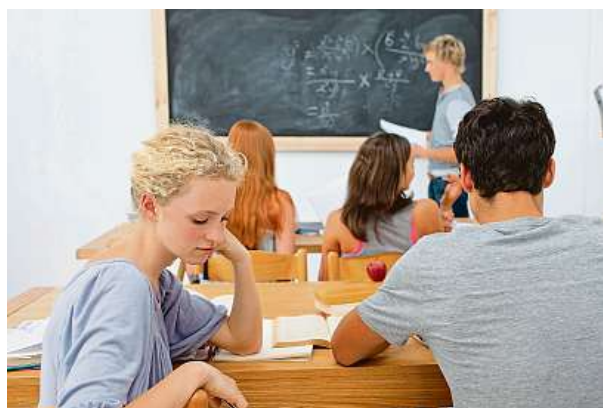
Finanční gramotnost žáků je povinnou součástí vzdělávání na základních a středních školách již od roku 2013.