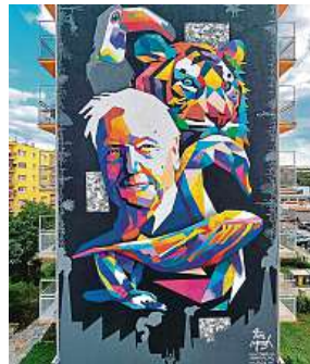
David Attenborough na novém muralu THE CHEMISTRY GALLERY

Do programu festivalu se také zapojí čtyři galerie současného umění The Chemistry Gallery, Karpuchina Gallery, Galerie Mega a Art Wall Gallery. V rámci svých výstav