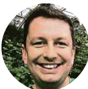
Petra Kvitová překvapí a dovrší hatrick.