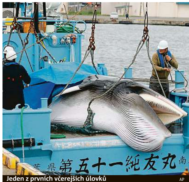
Jeden z prvních včerejších úlovků

Kytovce loví kvůli masu rovněž domorodé kmeny na ruské Čukotce nebo v Kanadě. Komerční lov funguje například v Norsku, tam je ale regulován. Velrybáři mohou ročně vylovit kolem tisícovky velryb z populace plejtváků malých ve vodách Atlantského oceánu. ČTK a MET