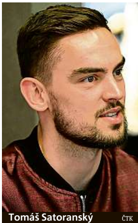
Tomáš Satoranský

Satoranský, který má za sebou tři sezony v NBA, si díky novému angažmá výrazně finančně polepší. Dosavadní tříletá nováčkovská smlouva mu zaručovala celkem devět milionů dolarů. S průměrným ročním příjmem deset milionů dolarů (224 milionů korun) bude Satoranský nejlépe placeným českým sportov-