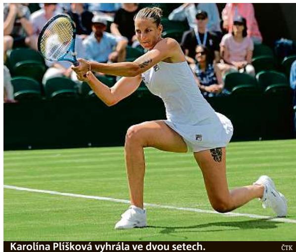
Karolína Plíšková vyhrála ve dvou setech.

Plíšková patří mezi hráčky, které mohou po londýnském grandslamu sesadit z postu světové jedničky Australanku Ashleigh Bartyovou. V druhém kole se utká buď s Móni-