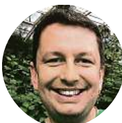
Petra Kvitová překvapí a dovrší hattrick.