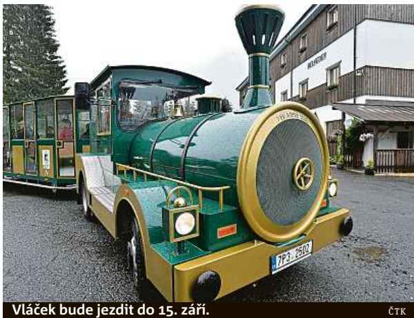
Vláček bude jezdit do 15. září.