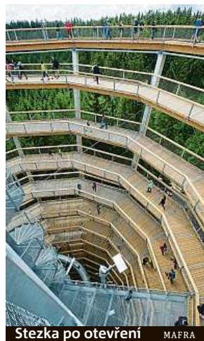
Stezka po otevření MAFRA

První výročí otevření Stezky korunami stromů Krkonoše si dnes veřejnost připomene celodenním kulturním programem. Bude připraven od 10 do 17 hodin. V areálu Stezky u Janských Lázní vystoupí například hudební skupina The Tap Tap a Sebastian, o dětskou zábavu se postará soubor VOSA z Trutnova, nervy diváků pocuchá skupina akrobatů na slacklinech, představí se také sokolníci, mimové a chůďaři. Vstupné na stezku činí pro dospělé 250 korun, pro děti 180, rodinná stojí 560 korun. MET