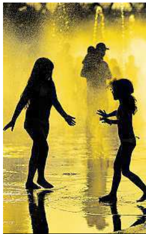
Madrid hlásí 40 stupňů.