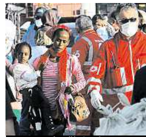
OSN: Zaslouží si ochranu.

Nebezpečnou cestu do Evropské unie přes Středozemní moře za první půlrok letošního roku podniklo 137 tisíc běženců, což je takřka dvojnásobek oproti stejnému období v loňském roce (75 tisíc). Vyplývá to z vydané zprávy Úřadu vysokého komisaře OSN pro uprchlíky. Každý třetí uprchlík, který se dostal na území jižních zemí Evropské unie, pochází ze Sýrie. Druzí nejčastěji jsou Afghánci a třetí obyvatelé Eritreje. Drtivá většina všech běženců se na náročnou a nebezpečnou cestu podle OSN vydala kvůli válce, násilnostem a útlaku ve vlasti. ČTK