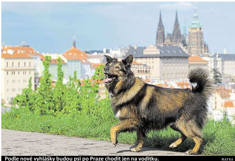
Podle nové vyhlášky budou psi po Praze chodit jen na vodítku.

Rada města proto v úterý souhlasila se záměrem vydat novou vyhlášku. Ta teď míří do připomínkového řízení, ve kterém se k ní mohou vyjádřit třeba městské části, městská policie nebo odbory magistrátu. „Lhůta pro zaslá-