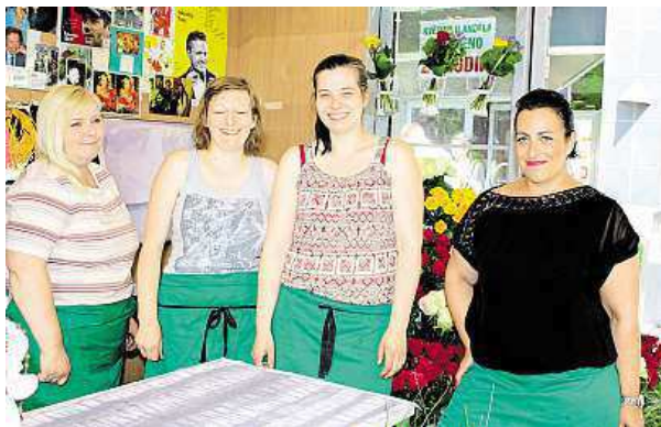
Holky z květinářství se budou otáčet.

Příjemnější ale hned tak nebude, a čím blíže víkendu, tím větší vedra máme očekávat. „Třicet šest stupňů bude v neděli a ještě během pondělka, ochlazení přijde až