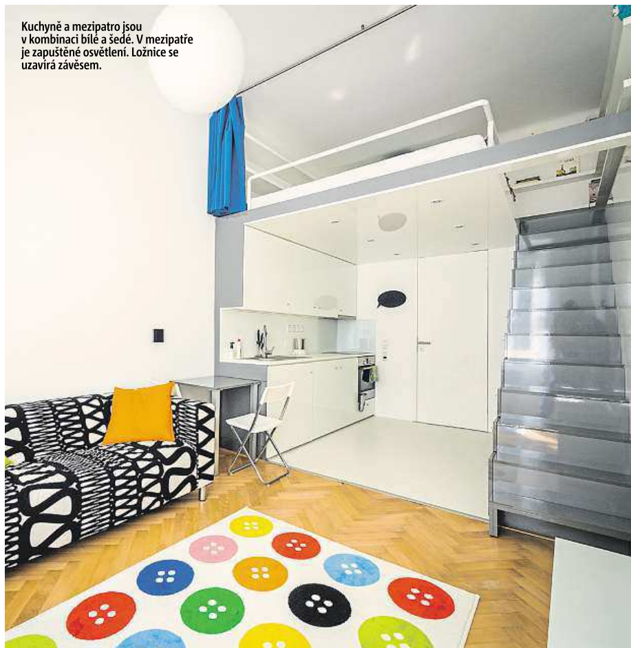
Kuchyně a mezipatro jsou v kombinaci bílé a šedé. V mezipatře je zapuštěné osvětlení. Ložnice se uzavírá závěsem.