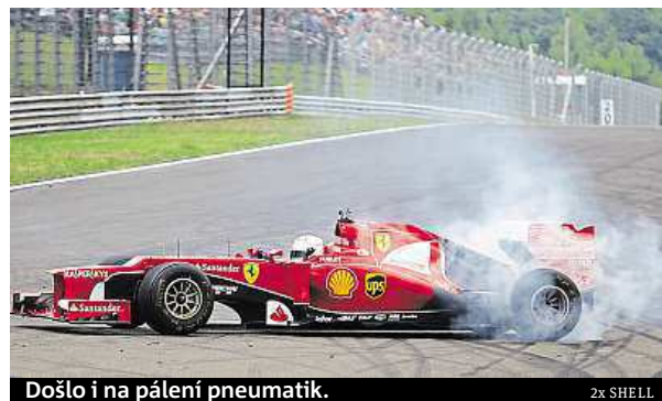
Došlo i na pálení pneumatik.