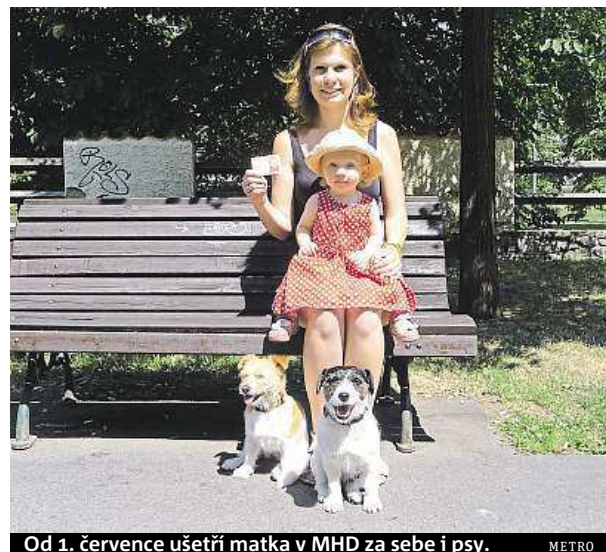
Od 1. července ušetří matka v MHD za sebe i psy. METRO