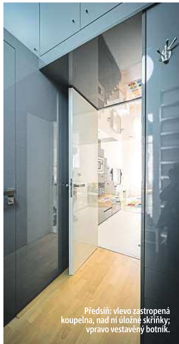
Předstíni: vlevo zastropená koupelna, nad ní úložné skříňky; vpravo vestavěný botník.