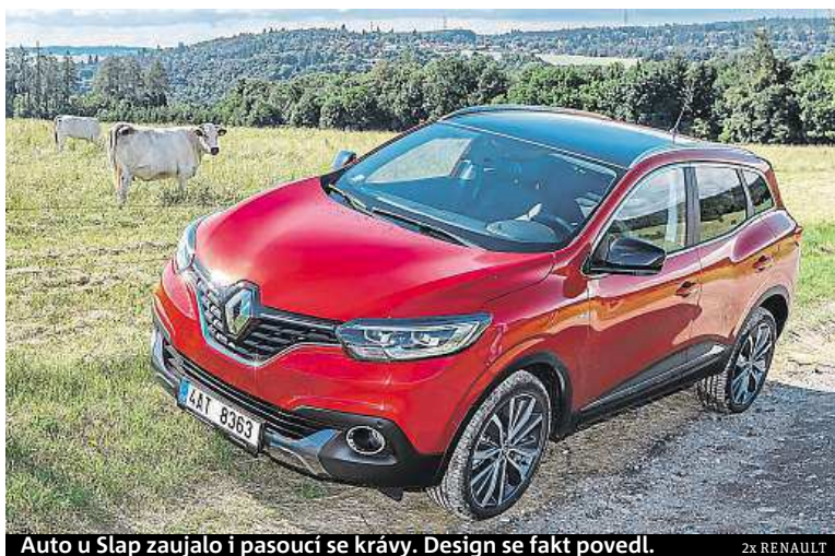
Auto u Slap zaujalo i pasoucí se krávy. Design se fakt povedl.