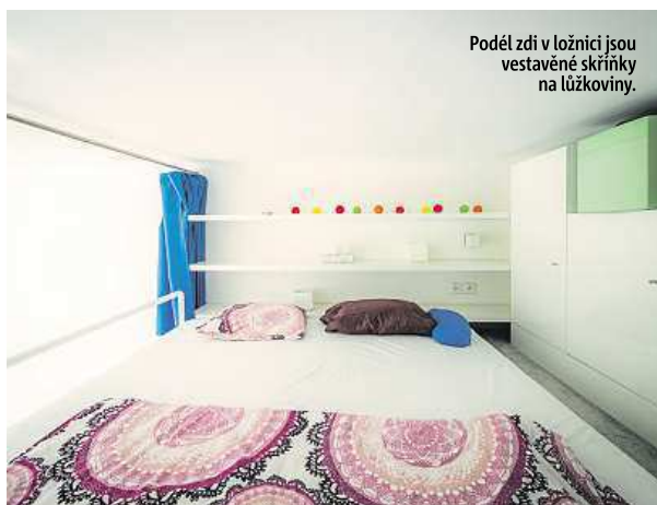
Podél zdi v ložnici jsou vestavěné skříňky na lůžkoviny.