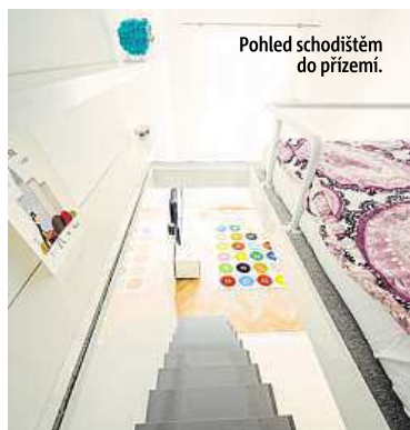
Pohled schodištěm do přízemí.