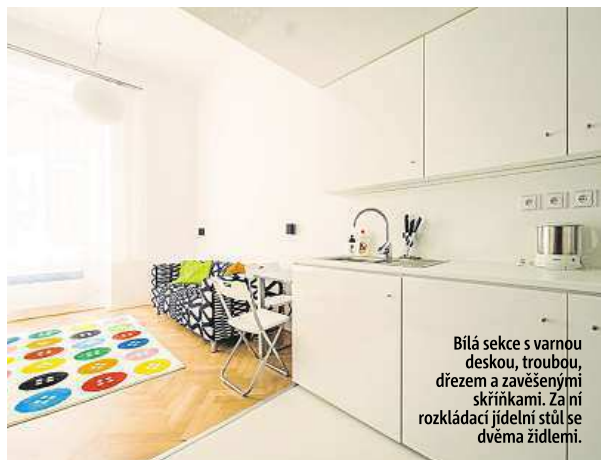
Bílá sekce s varnou deskou, troubou, dřezem a zavěšenými skříňkami. Za ní rozkládací jídelní stůl se dvěma židlemi.