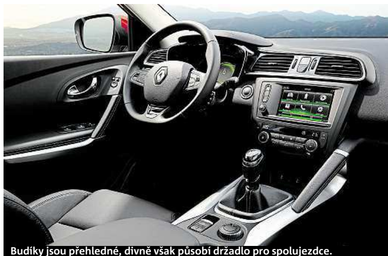
Budiky jsou přehledné, divně však působí držadlo pro spolujezdce.