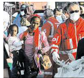
OSN: Zaslouží si ochranu.

Nebezpečnou cestu do Evropské unie přes Středozemní moře za první půlrok letošního roku podniklo 137 tisíc běženců, což je takřka dvojnásobek oproti stejnému období v loňském roce (75 tisíc). Vyplyvá to z vydané zprávy Úřadu vysokého komisaře OSN pro uprchlíky. Každý třetí uprchlík, který se dostal na území jižních zemí Evropské unie, pochází ze Sýrie. Druzí nejčastěji jsou Afghánci a třetí obyvatelé Eritreje. Drtivá většina všech běženců se na náročnou a nebezpečnou cestu podle OSN vydala kvůli válce, násilnostem a útlaku ve vlasti. ČTK