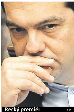
Řecký premiér

Tsipras „přijme všechny podmínky věřitelů, které byly na stole o víkend, jen s několika malými změnami,“ píše se ve dvoustránkovém dopise. Podle agentury Reuters však bude některé věci z Tsiprasova dopisu pro řadu zemí eurozóny těžké přijmout, navíc se může jednat o další řeckou lest. Tomu nasvědčuje i včerejší Tsiprasovo vystoupení v tele-