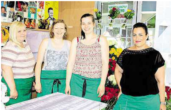
Holky z květinářství se budou otáčet.

Příjemnější ale hned tak nebude, a čím blíže víkendu, tím větší vedra máme očekávat. „Třicet šest stupňů bude v neděli a ještě během pondělka, ochlazení přijde až