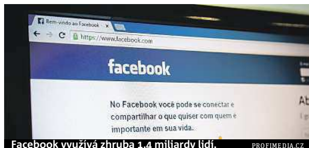
Facebook využívá zhruba 1,4 miliardy lidí.