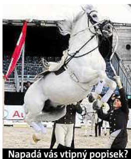
Napadá vás vtipný popisěk?

Napište bublinu a reagujte na sloupek na: www.facebook.com/denikmetro