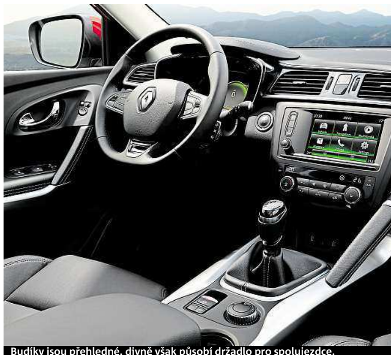
Budíky jsou přehledné, divně však působí držadlo pro spolujezdce.