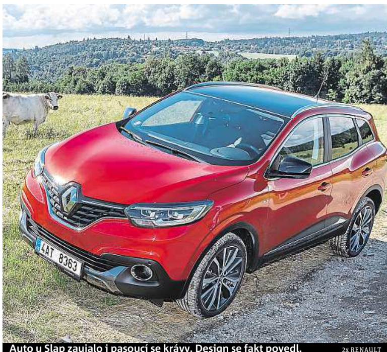
Auto u Slap zaujalo i pasoucí se krávy. Design se fakt povedl.