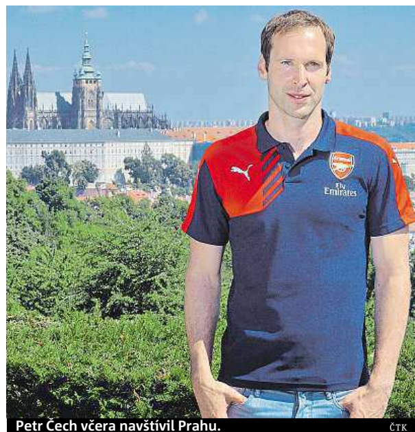
Petr Čech včera navštívil Prahu.

S Chelsea Čech vyhrál Ligu mistrů, Evropskou ligu, Premier League i oba anglické do-