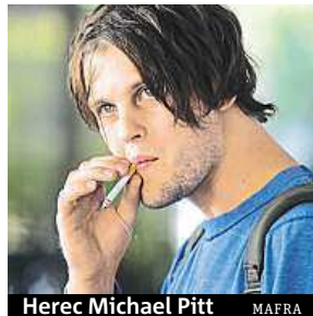
Herec Michael Pitt

Michael Pitt se na karlovarský festival vrátí po devíti le-