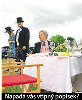
Napadá vás vtipný popisec?

Napište bublinu a reagujte na sloupek na: www.facebook.com/denikmetro