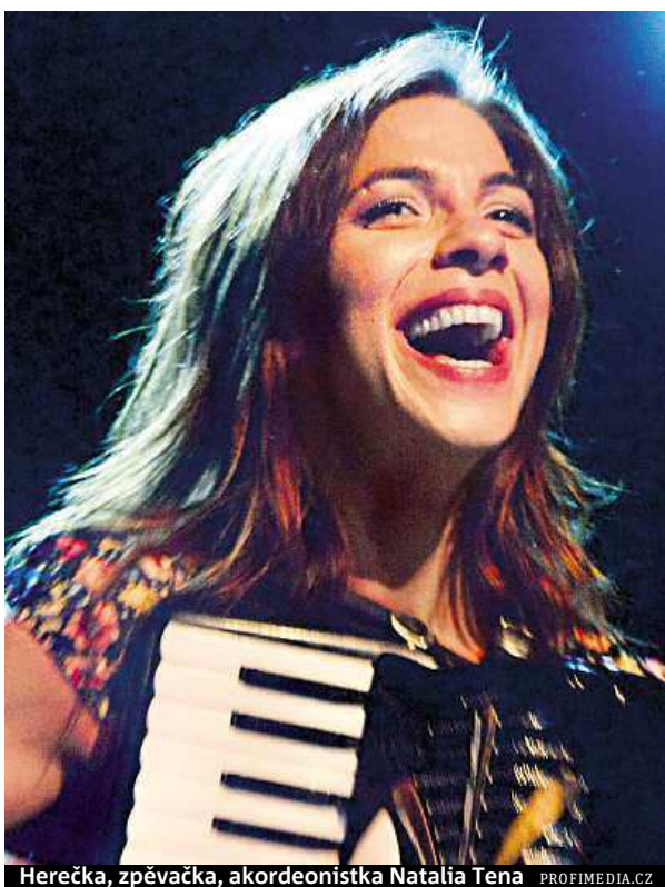
Herečka, zpěvačka, akordeonistka Natalia Tena

Začíná léto a s ním nekoněné množství festivalů. Proč jste si vybrali mimo jiné po tak krátké době znovu Rock for People?