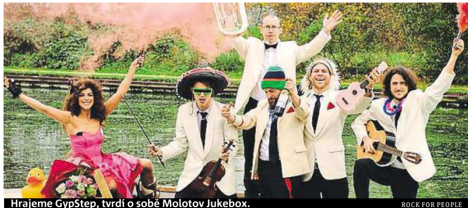
Hrajeme GypStep, tvrdí o sobě Molotov Jukebox.