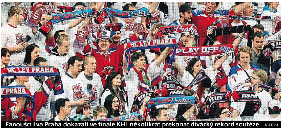
Fanoušci Lva Praha dokázali ve finále KHL několikrát překonat divácký rekord soutěže.