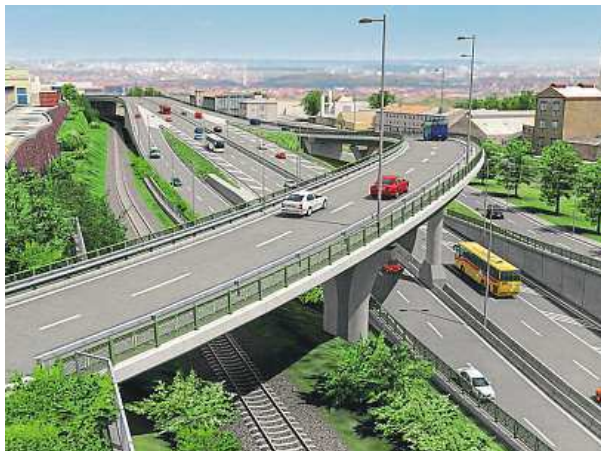
Na novou radiálu se bude odbočovat na Zličově. SUBTERRA

Stavba začíná vybudováním průzkumné štoly dlouhé 850 metrů, která má ověřit inženýrsko-geologické podmínky jednoho z tunelů. „Byla zahájena stavba a hloubí se 14 metrů hluboká těžná šachta,“ potvrdil Beneš. Na výstavbu Radlické radiály má město v rozpočtu vyčleněno zhruba sto milionů korun, z toho má