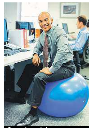
Sezení v práci

Tento požadavek podle průzkumu IRMES nespĺňuje 75 procent Francouzů ve věku od 18 do 64 let. A počet těch, kdo se pravidelně věnu-