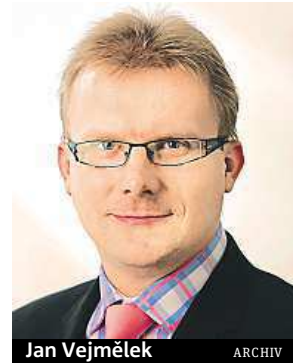
Jan Vejmělek ARCHIV

Co stojí za růstem české ekonomiky? Podle hlavního ekonomy Komerční banky Jana Vejmělky je to zejména průmysl, který profituje ze silnější zahraniční poptávky, což se odráží v silných exportech. „Příznivá zpráva je, že růst v průmyslu je tak výrazný a očekávání do budoucna tak příznivá, že firmy začínají rozšiřovat své výrobní kapacity. Přepokládáme, že v dalších čtvrtletích česká ekonomika dále poroste,“ říká Vejmělek. Dubnová prognóza KB počítala s letošním celoročním růstem o 1,9 %. „Nyní se zdá, že výsledek by mohl být ještě lepší. Pro příští rok pak očekáváme hospodářský vzestup o 2,6 %. Oživení v ekonomice se bude dále promítat do klesající nezaměstnanosti a v příštím roce i do růstu nominálních mezd.“