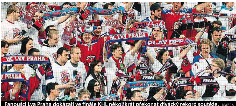
Fanoušci Lva Praha dokázali ve finále KHL několikrát překonat divácký rekord soutěže.