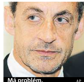
Má problém.

Expresident je zadržen. Poprvé v moderních dějinách Francie.