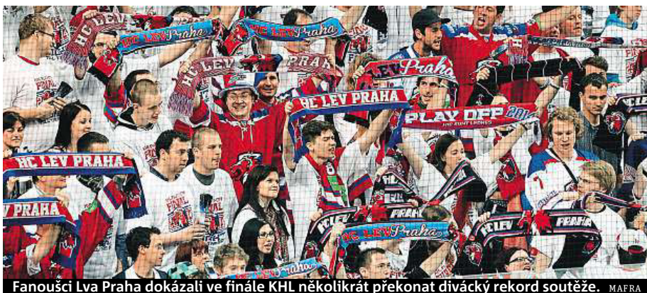
Fanoušci Lva Praha dokázali ve finále KHL několikrát překonat divácký rekord soutěže.