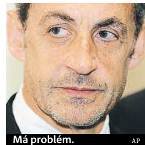
Má problém.

Expresident je zadržen. Poprvé v moderních dějinách Francie.