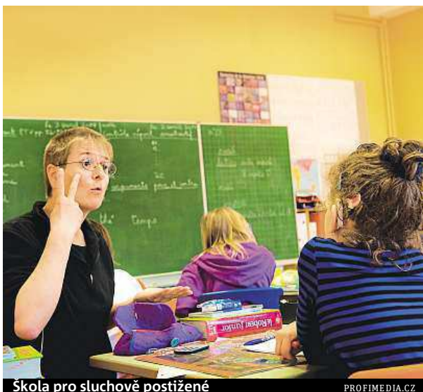
Škola pro sluchově postižené

Po bakaláři by chtěla jít ještě na magistra. „Bohužel u nás