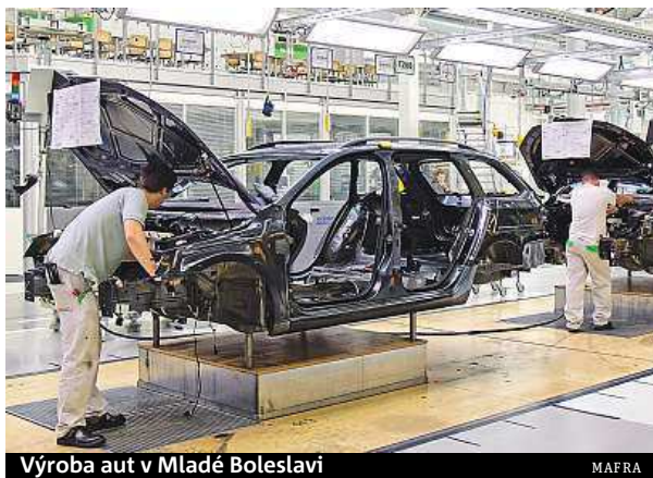
Výroba aut v Mladé Boleslavi

„Vliv ale měly všechny jeho složky. Výdaje domác-