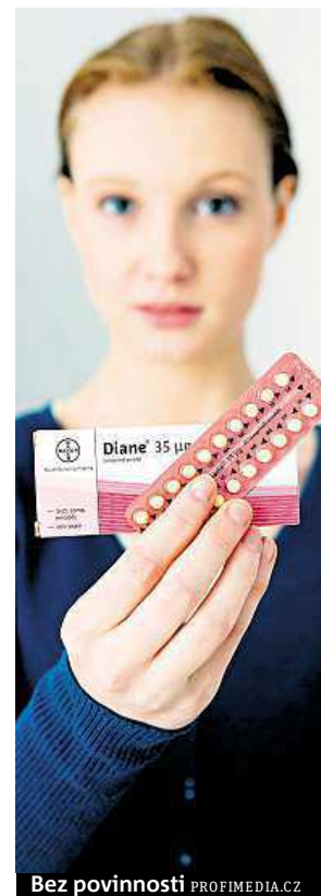
Bez povinnosti PROFIMEDIA.CZ

Američtí zaměstnavatelé mohou z náboženských důvodů odmítnout svým zaměstnankyním hradit antikoncepční pilulky. Rozhodl o tom Nejvyšší soud Spojených států, podle jehož verdiktu mají ve sporných případech zaměstnavatelé právo na výjimku ze zákona prosazeného prezidentem Barackem Obamou. Bílý dům prohlásil, že verdikt povede k ohrožení zdraví řady žen používajících antikoncepci. Podle agentury AP je to vůbec poprvé, co nejvyšší soud přikl komerčním subjektům právo na náboženský postoj. Tabletky proti početí jsou zahrnuty do té části zdravotní prevence, která musí být podle Obamova zákona o zdravotní péči z roku 2010, kritizovaného opozicí, zaměstnankyním hrazena bez jakýchkoli doplateků. ČTK