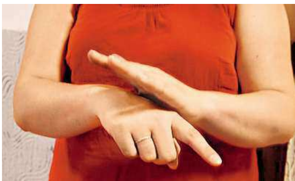
Toto je znak pro náš deník i dopravní prostředek metro. MET

Eliška Korbová chce v budoucnu učit ve škole pro sluchově postižené. Proto začala studovat obor čeština v komunikaci neslyšících.