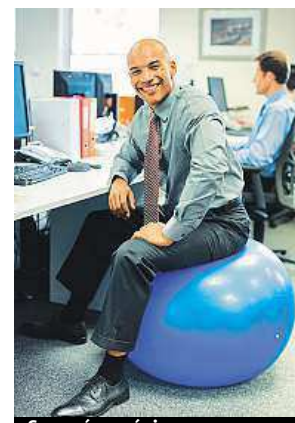
Sezení v práci

Tento požadavek podle průzkumu IRMES nespĺňuje 75 procent Francouzů ve věku od 18 do 64 let. A počet těch, kdo se pravidelně věnu-