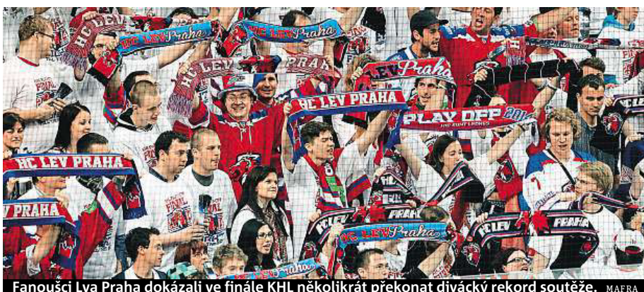
Fanoušci Lva Praha dokázali ve finále KHL několikrát překonat divácký rekord soutěže.