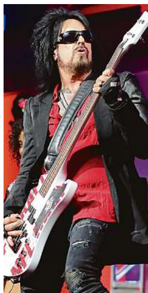
Nikki Sixx, basák a zakladatel kapely Mötley Crüe

Fanouškové se mohou těšit i na speciálního hosta – českou rockovou kapelu Kabát, australské rockery Wolfmother nebo vycházející hvězdy Eclipse.