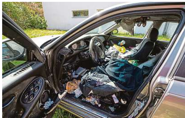
Některé vraky v ulicích se postupem času mění v noclehárny nebo odpadové „kontejnery“. Ale taky ve zdroj hygienických rizik.

Nemusí se tedy jednat jen o vyslovené autovraky, které postávají i bez registračních značek, protože o ně majitelé ztratili zájem nebo jsou pohodlní nechat je ekologicky zlikvidovat. Už v minulosti některá města umožňovala, aby lidé sami posílali fotografie o umístění nepojízdného au-