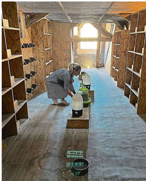
Umělé vejce jsou z plastu, holub na nich sedí zhruba 20 dní. Poté hnízdění vzdá.

Podkroví naproti magistrátu ale není jediné, kam holubi létají. Spolek proto plánuje, že se domluví s majiteli domů v centru Prahy a bude