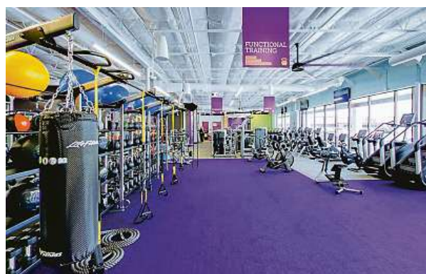
Fitness klub, kam si můžete dojít zacvičit třeba ve tři ráno v neděli? Anytime Fitness má na tom postavený celý koncept. ANYTIME FITNESS