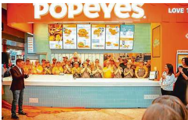
Popeyes má velké plány. Když se bude dařit jeho novým čtyřem českým podnikům, otevře v následujících letech dalších osm. POPEYES

Do tuzemska by již brzy mohl vtrhnout také fastfood Duck Donuts. Jeho sortiment do jisté míry připomíná nabídku konkurenta Donuter Donuts, který v Česku aktuálně působí. Základ tvoří koblíhy, které si ozdobíte podle svých představ, sendviče, zmrzlina nebo koktejly. První pobočka ve Spojených státech otevřel v roce 2007, o šest let později vznikla první franšiza. V současnosti má Duck Donuts přes 215 poboček ve Spojených státech, další vznikají za hranicemi.