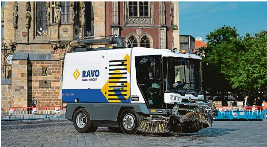
Vůz RAVO 5 eSeries jezdí rychlostí až 40 km/h, má nosnost až 4900 kilogramů a je ideální pro rychlé čištění nádob, mobiliáře či pro vysávání listí a vyprazdňování odpadkových košů.