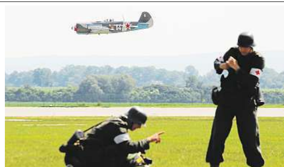
Aviatická pouť propojuje létání s rekonstrukcí bojů

Součástí budou opět oblíbené velkoprostorové scény, kdy se spojí letové ukázky s pozemní rekonstrukcí bojů.