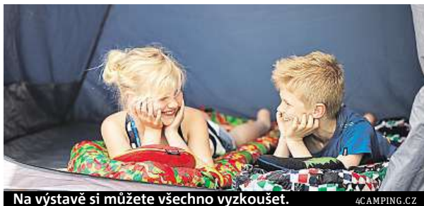
Na výstavě si můžete všechno vyzkoušet.

Češi jsou národem grilařů a kempování. „Trendy v outdooru se oproti loňsku moc ne-