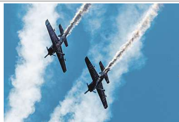
Nejenom Flying Bulls Aerobatics Team