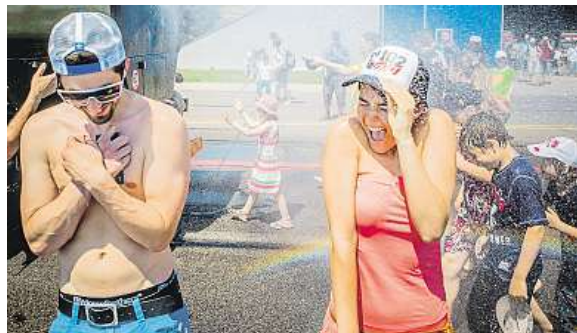
Na minulých akcích se zájemci dočkali osvěžení.

• Velkým lákadlem bude i vystoupení unikátních letadel s červenými býky na trupu – akrobatické skupiny Flying Bulls Aerobatic Team, jež létá na moderních akrobatických speciálech Xtreme XA42.