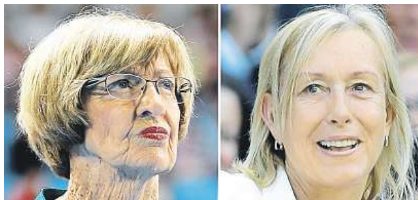
Margaret Courtová a Martina Navrátilová

Tenistka Martina Navrátilová odsoudila postoj australské legendy Margaret Courtové, která se opakovaně kriticky vyjadřuje na adresu homosexuálů. „Teď je naprosto jasné, kdo Courtová je: úžasná tenistka a rasistka a homofobka,“ prohlásila Navrátilová. Ta navíc navrhla, aby pořadatele Australian Open přejmenovali kurt v Melbourne, který nese jméno Courtové. ČTK