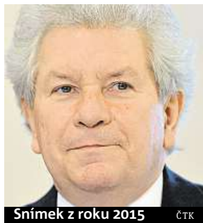
Snímek z roku 2015

a někdejšího šéfa proslulého londýnského Symfonického orchestru BBC hudebníci a další umělci z Česka i zahraničí označili za velkou ztrátu. Připomínají jeho práci s filharmonií i zásluhy na propagaci české hudby v zahraničí. Pro filharmonii je jeho odchod nenahraditelnou ztrátou. Zprávu o úmrtí přinesly všechny světové agentury. Na Rudolfinu, kde vrcholí hudební festi-