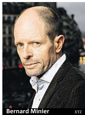
Bernard Minier XYZ

Autor tentokrát odhaluje naše nejskrytější noční můry, fobie a obsese. Co se stane, když někdo převezme kontrolu nad vašim životem a vztahy? V napínavém příběhu tentokrát Bernard Minier čtenáře zavede až na vesmírnou stanici a do prostředí vesmírných kovbojů.