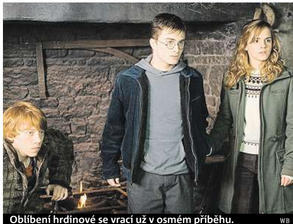
Oblíbení hrdinové se vrací už v osmém příběhu.

Harry to nikdy neměl snadné a teď, jako přepracovaný zaměstnanec ministerstva kouzel, manžel a otec tří školáků, to má ještě těžší. Potýká se s minulostí, která nechce zůstat tam, kam patří, a jeho syn Albus se mezitím musí prát s tíhou rodinného dědictví, o které nikdy nestál. ROW