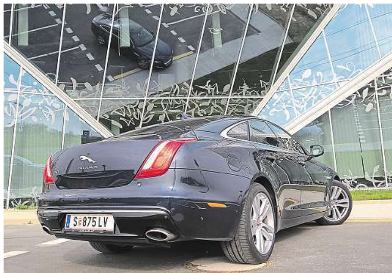
Zadní svítlíky se povedly. Podtrhují ladnou linku Jaguaru XJ.