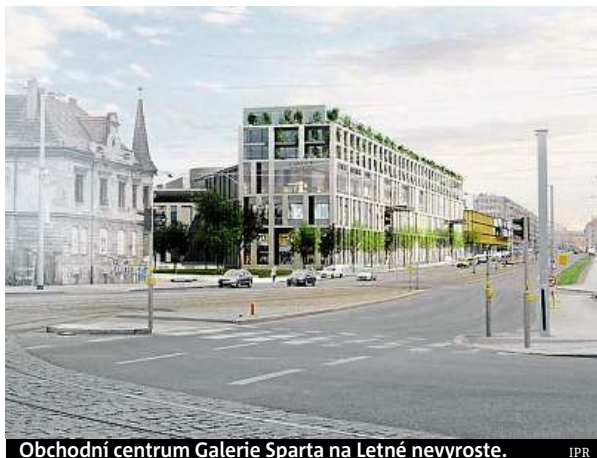
Obchodní centrum Galerie Sparta na Letné nevyroste. IPR

Se stavbou už vyjádřila souhlas komise rozvoje Prahy 7.