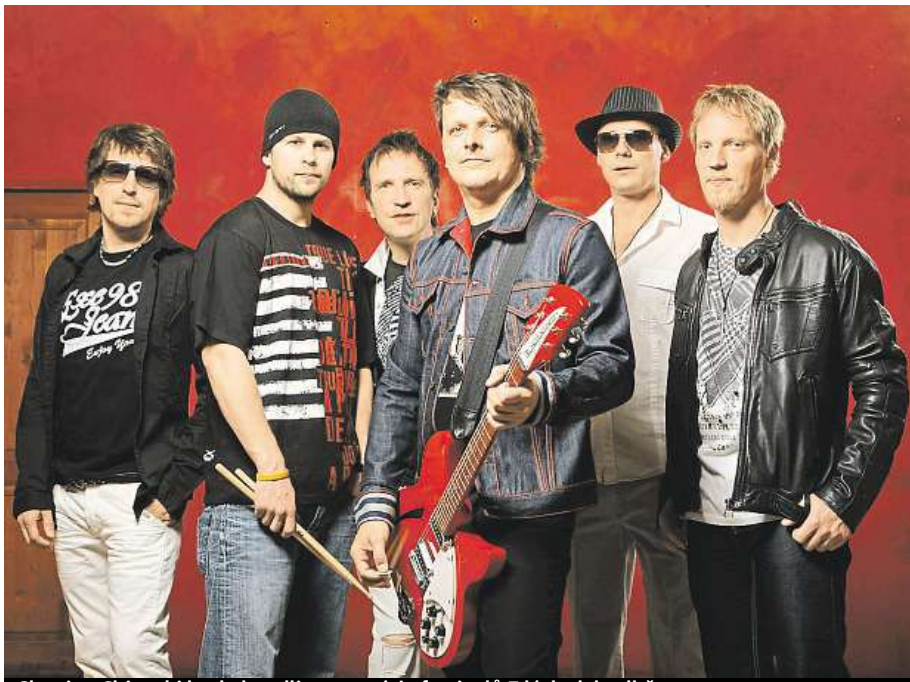
Skupina Chinaski bude headlinerem série festivalů Z lásky k hudbě.