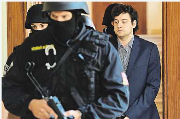
Dahlgren u soudu