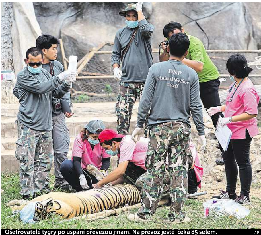
Ošetřovatelé tygry po uspání převezou jinam. Na převoz ještě čeká 85 šelem.

Celkem bylo v chrámu, který byl turistickou atrakcí, chováno 137 tygřů. Úřady ale mnichy dlouho podezřívaly z týrání a obchodování se zvířaty. V některých asijských zemích, například v Číně, se stále udržuje pověra, že tygří ingredience, zejména prášek z jejich kostí, mají afrodisiakální účinky. Úřady se tedy rozhodly i na základě mezinárodního tlaku organizací pro