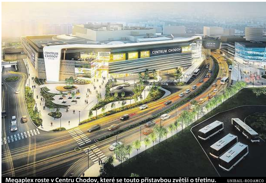
Megaplex roste v Centru Chodov, které se touto přístavbou zvětší o třetinu. UNIBAIL-RODAMCO

Chodově se zaměří také na starší a méně navštěvované filmy, jimiž má bohatě doplnovat ty největší premiéry. Mimoto příhodí druhý sál s 4DX v metropoli a něco na způsob Gold Classu, měl by tedy vytáhnout hodně rozmanitou nabídku služeb.