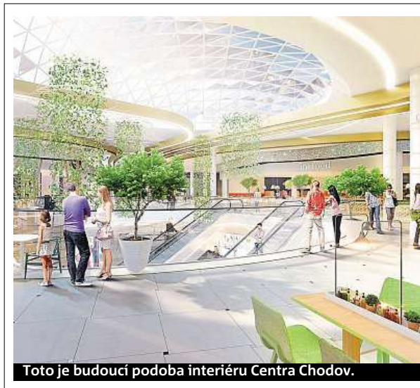
Toto je budoucí podoba interiéru Centra Chodov.