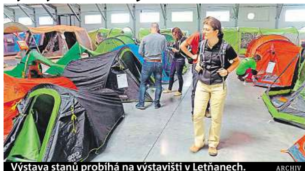
Výstava stanů probíhá na výstavišti v Letňanech.

6. Kotvící šňůrky: Pokud jsou nenápadné, tak vás sice nikdo nenajde, ale může o šňůrky zakopnout.