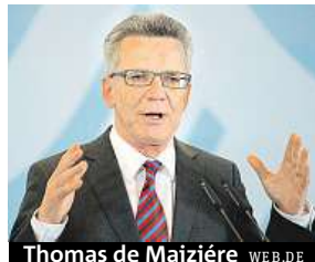
Thomas de Maizière

Když se propojují teroristé, musí se spojit i tajné služby, říká ministr.