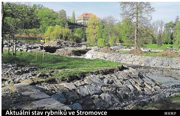
Aktuální stav rybníků ve Stromovce MHMP

V parku Stromovka se po roce a půl opět napouštějí rybníky. Jejich stav nebyl v poslední době ideální. Zpevnění břehů se zcela rozpadlo, a proto byly stále více podmiňovány vlivem eroze a sešlapáním. Mostky přes rybníky byly poškozeny. V první fázi prací byly tedy rybníky odbahněny, poté se vybudovalo nové zpevnění břehů. Vegetace se bude osazovat během léta a to především v nejméně namáhaných částech břehů. MET