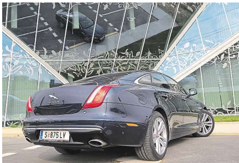
Zadní svítilny se povedly. Podtrhují ladnou linku Jaguaru XJ.