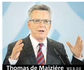
Thomas de Maizière WEB.DE

Německé tajné služby začnou s partnery v Evropské unii a v NATO vytvářet společné databáze lidí, kteří se zapojili do bojů v rámci teroristických skupin. Vláda včera přijala návrh zákona, který německým rozvědkám sdílení informací umožní. „Když se propojují mezinárodní tero-