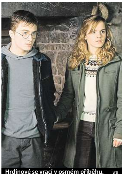
Hrdinové se vrací v osmém příběhu.

Harry to nikdy neměl snadné a teď, jako přepracovaný zaměstnanec ministerstva kouzel, manžel a otec tří školáků, to má ještě těžší. Potýká se s minulostí, která nechce zůstat tam, kam patří, a jeho syn Albus se mezitím musí prát s tíhou rodinného dědictví, o které nikdy nestál.