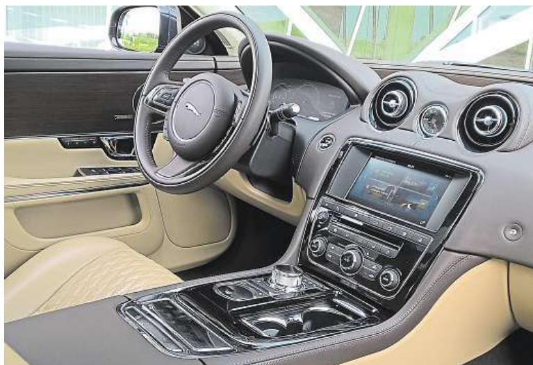
Takhle je cítit luxus. Dotyková obrazovka funguje dobře.