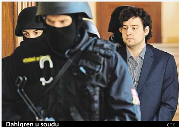
Dahlgren u soudu