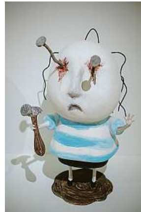
Tim Burton odmítá být i někdy dojemnou morálkou dospělých.