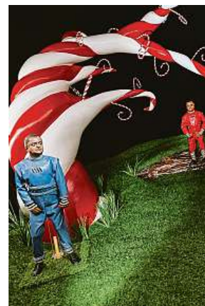
Umpa-lumpové jsou trpaslíci z Karlíka a továrny na čokoládu.

Výstava, která je od včerejška přístupná v pražském Obecním domě do konce září, nabídne evropskému divákovi i pohled do historie zaoceánského zábavního průmyslu, jeho excesů a obskurních fo-