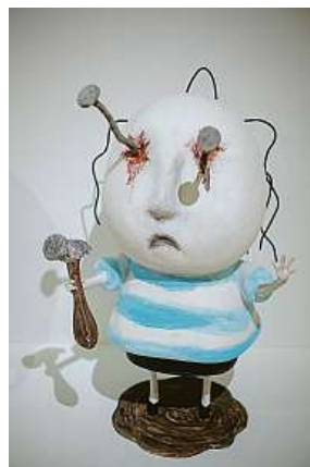
Tim Burton odmítá být i někdy dojemnou morálkou dospělých.