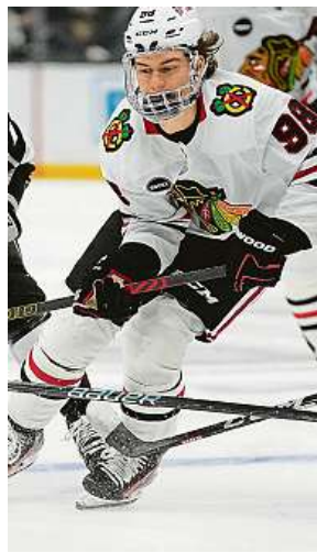
Mladá superstar NHL Connor Bedard si zahraje za Kanadu.

Tým javorových listů kromě Bedarda přiveze do Prahy například brankáře Jordana Binningtona ze St. Louis, útočníky Cozense (Buffalo), Mercera (New Jersey) či dvojici ze Seattlu Tanev – McCann. Z obránců přijedou Jamie Oleksiak ze Seattlu, Power a Bowem Byram z Buffala