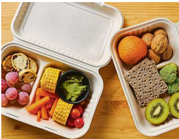
Na trhu existuje celá řada firem s nejrůznější nabídkou, obecně se ceny ale pohybují kolem 400 až 500 korun za den.

Dotyčná firma vše připraví a naservíruje za vás. Tato dieta proto může být ideálním řešením pro vytižené osoby s aktivním pracovním i osobním životem, pro maminky