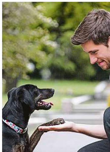
Nushart je absolventem desítek kurzů v oblasti etologie a behaviorální analýzy.

Vědomosti majitele. Protože ty rozhodují už třeba o výběru vhodného plemene, jenž je klíčový. Pokud chce někdo gaučáka a vezme si pracovní border kolii, asi nebude spokojený ani jeden z nich. Jednou z nejčastějších vět, kterou pak na prvních trénincích od majitelů slyším, je: „Vy vlastně trénujete spíš lidi.“ A je to pravda. Je to úplně stejné jako v jakémkoli jiném odvětví. Když budu kuchař začátečník a nebudu znát recept na jídlo, nebudu vědět, jak ho připravit a z jakých surovin, asi nekuchtu nic slavného. Trénink zví-