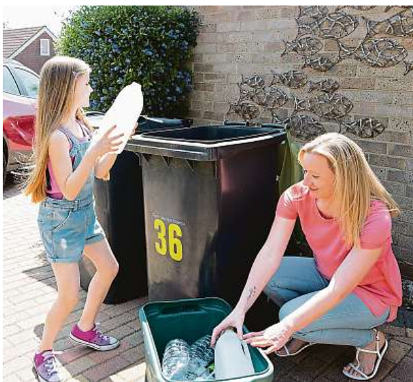
Obaly z krabičkového dovozu jídel není možné z hygienických důvodů vrátet, přírodě tak pomůže aspoň důsledné třídění.

Tematika samotného jídelníčku je velmi komplexní. Vedle ní ale stojí další zásadní otázka, která trochu zasahuje do ekologie. Jídla se zákazníkům v drtivé většině případů vozí v plastových krabičkách. Ty si však firmy z hygienických důvodů nemohou odebrat zpět a dát do nich jídlo někomu jinému. Podobně to