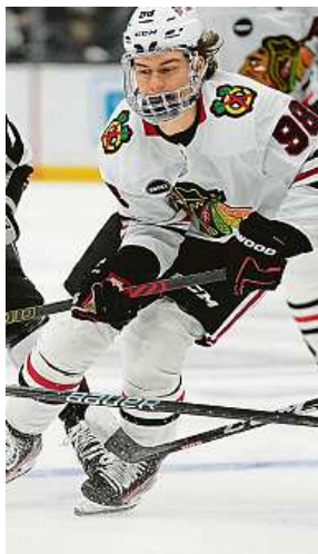
Mladá superstar NHL Connor Bedard si zahraje za Kanadu.

Tým javorových listů kromě Bedarda přiveze do Prahy například brankáře Jordana Binningtona ze St. Louis, útočníky Cozense (Buffalo), Mercera (New Jersey) či dvojici ze Seattlu Tanev – McCann. Z obránců přijedou Jamie Oleksiak ze Seattlu, Power a Bowem Byram z Buffala