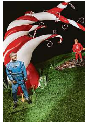
Umpa-lumpové jsou trpaslíci z Karlíka a továrny na čokoládu.

Výstava, která je od včerejška přístupná v pražském Obecním domě do konce září, nabídne evropskému divákovi i pohled do historie zaoceánského zábavního průmyslu, jeho excesů a obskurních fo-