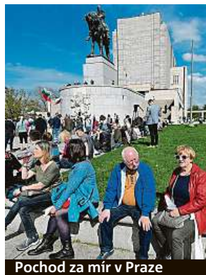
Pochod za mír v Praze