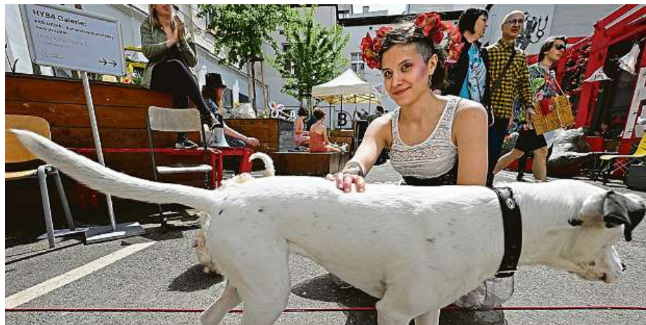
V pražském kampusu v Hybernské ulici před vyhlášením krále Studentského Majálesu