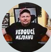
Stago Msr Tábor jsem rád neměl, vždy mi bylo něco ukradeno.