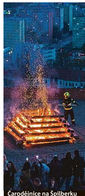
Čarodějnice na Špilberku

Hasiči letos při pálení čarodějnic v neděli vyjžděli k 69 požárům, což bylo o 19 méně než loni. Většina z nich ale s pálením filipojakubských ohňů nijak nesouvisela. Podle hasičů byly oslavy klidné. Méně požárů bylo v posledním dubnovém den naposledy v roce 2019. Vyplývá to z informací na webu hasičů. Hasičský záchranný sbor ČR na Twitteru uvedl, že lidé předem nahlásili více než 7500 pálení čarodějnic. „Díky tomu se eliminovalo značné množství planých výjezdů,“ podotkli hasiči. Od nedělního večera do rána zaznamenali 33 požárů v přírodním prostředí, a to včetně odpadů a skládek. ČTK