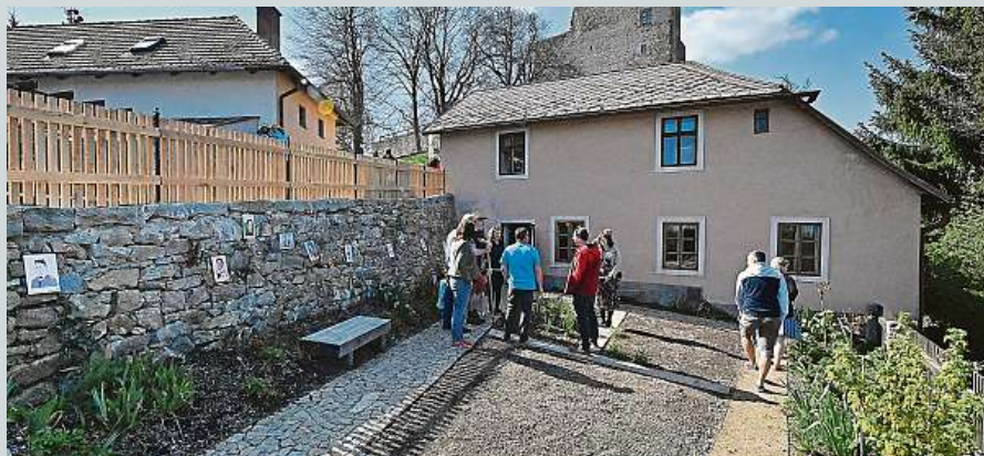
Před 140 lety se narodil Jaroslav Hašek. V jeho domě se otevřela kuchyňka a zahrádka. ČTK