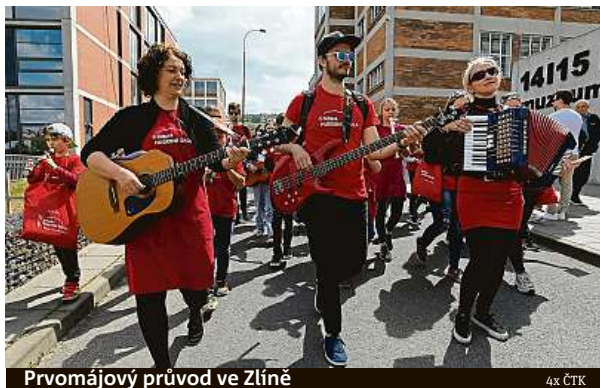
Prvomájový průvod ve Zlíně