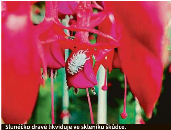
Sluněčko dravé likviduje ve skleníku škůdce.