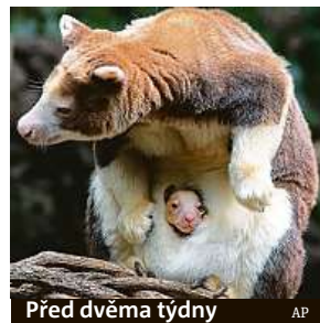
Před dvěma týdny

Klokan Matschieův je největší stromový klokan na své