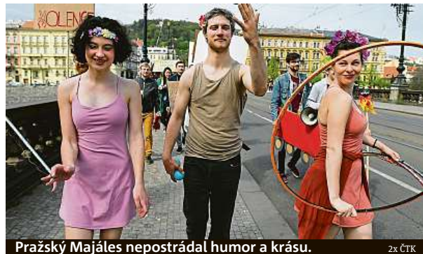
Pražský Majáles nepostrádal humor a krásu.