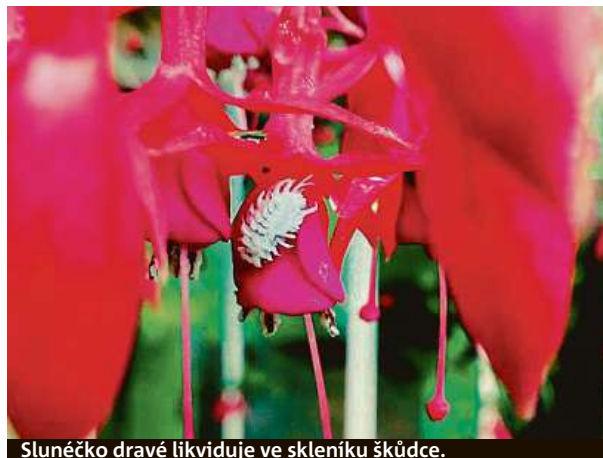
Sluněčko dravé likviduje ve skleníku škůdce.