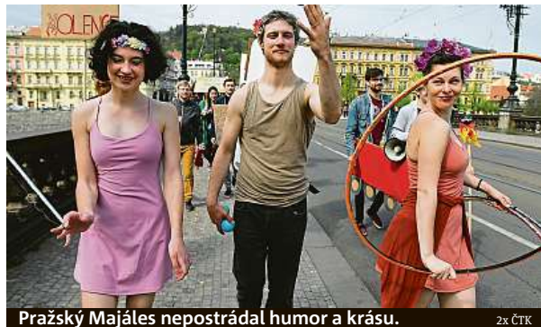
Pražský Majáles nepostrádal humor a krásu.