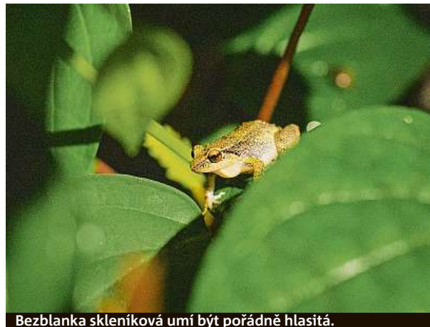
Bezblanka skleníková umí být pořádně hlasitá.