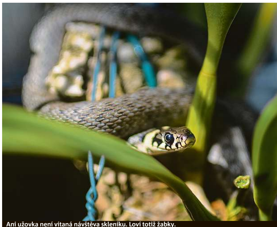
Ani užovka není vítaná návštěva skleníku. Loví totiž žabky.

Pravděpodobně během výstavy mravenců do skleníku pronikl tropický mravenec rodu Technomyrmex . Tento mravenec nežije jako většina jiných v mraveništi, kde je jediné královna schopná klást vajíčka, ale členové společenstva žijí decentralizovaně v menších skupinkách, protože vajíčka mohou snášet dělnice. Z toho důvodu je těžké se jich zbavit, protože vytváří samostatné buňky, spíš jakousi síť „vesnic“ než jedno velké „město“. Koexistence s nimi je nepřijemná, ale ve skleníku vadí především proto, že „pasou“ škůdce, jako jsou vlnatky nebo puklice a roznášejí je po celé expozici. MARTIN DVOŘÁK A PETR VACÍK