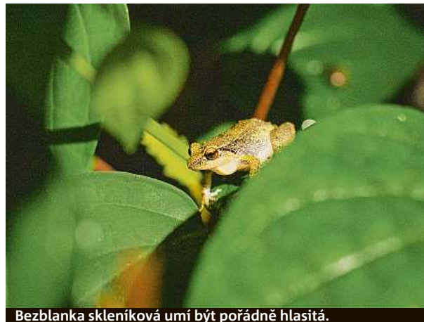
Bezblanka skleníková umí být pořádně hlasitá.