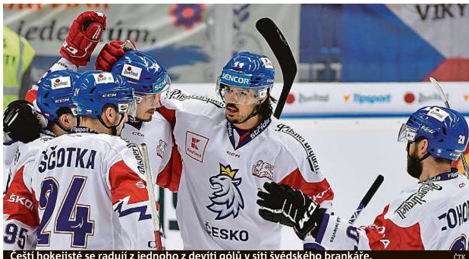
Čeští hokejisté se radují z jednoho z devíti gólů v síti švédského brankáře.