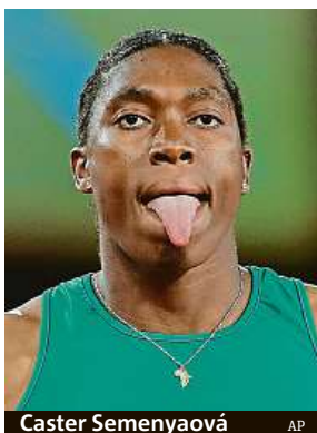
Caster Semenyaová AP

Olympijská šampionka z let 2012 a 2016 a trojnásobná mistryně světa je nejznámější atletkou, na kterou nové pravidlo dopadá. Osmadvacetiletá běžkyně má ještě možnost obrátit se během třiceti dnů na švýcarský soud. IAAF se rozhodla zavést kontroverzní pravidlo na základě odborné studie, podle níž mají atletky s odlišným sexuálním vývojem díky při-