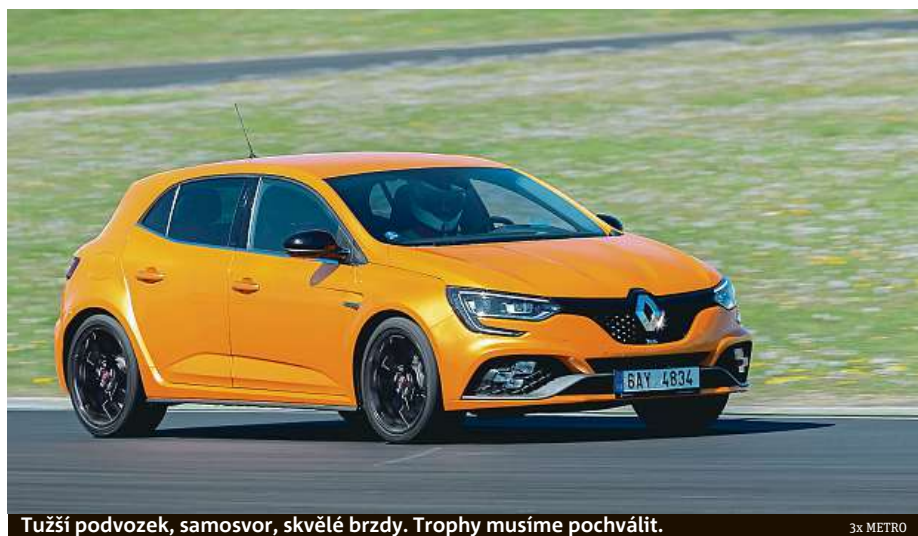
Tužší podvozek, samosvor, skvělé brzdy. Trophy musíme pochválit.