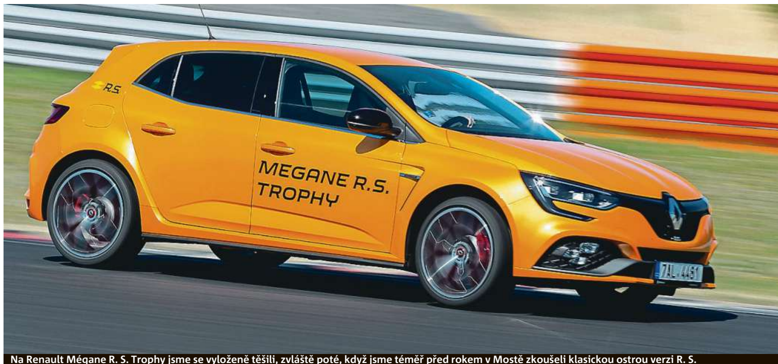
Na Renault Mégane R. S. Trophy jsme se vyloženě těšili, zvláště poté, když jsme téměř před rokem v Mostě zkoušeli klasickou ostrou verzi R. S.

Vyzkoušeli jsme při ostré jízdě nový vrchol řady Renault Mégane. Trophy je ostrý Francouz.