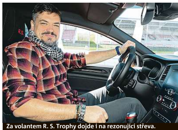
Za volantem R. S. Trophy dojde i na rezonující střeva.

Uvidíme, připlatit si těch 100 tisíc korun se podle nás opravdu vyplatí. PETR HOLEČEK