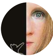
Jana Krejčí Hrdina všech lenochů, Garfield!