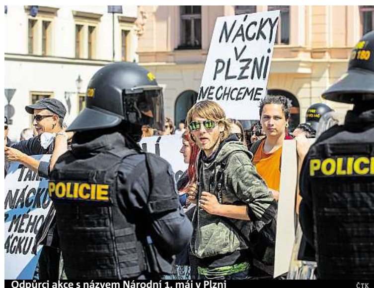
Odpůrci akce s názvem Národní 1. máj v Plzni ČTK

První máj se slavil také v Plzni. Tam dění ve městě ovládli stoupenci krajní pravice. Sešli se tam příznivci Dělnické strany sociální spravedlnosti (DSSS). Kromě nich na plzeňském náměstí demonstrovaly také občanské sdružení Dělnická mládež (DM) a pravicové protiislámské hnutí Blok proti islamizaci. Příznivců krajní pravice byly přibližně dvě stovky, jejich odpůrců zhruba padesát. Skupiny oddělovalo asi dvacet policistů. Odpůrci pravicových demonstrantů, kteří se