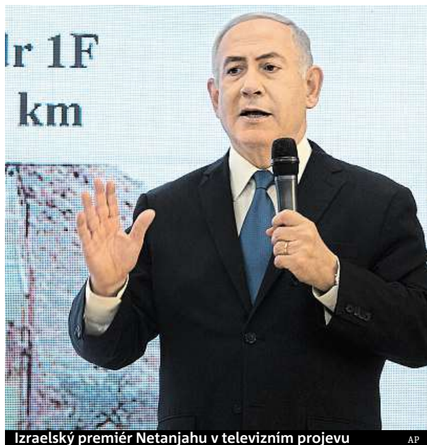
Izraelský premiér Netanjahu v televizním projevu

„Lidé Íránu vždy popírají, že chtějí jaderné zbraně,“