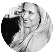
Ávina Stašina Zákaz nám to trochu překazil, ale náladu nám tím nezkažil.