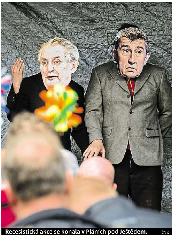
Recesistická akce se konala v Pláních pod Ještědem.