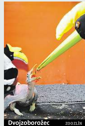
Dvojboborožec ZOO ZLÍN

Zlínská zoologická zahrada odchovala jako první v Česku mládě dvojzoborožce indického. Jeho odchov je náročný. Problém