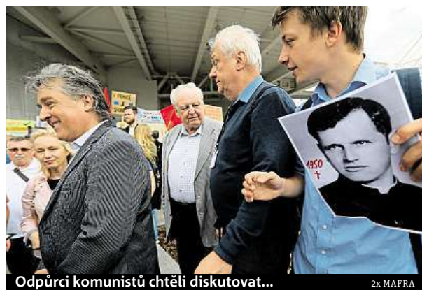
Odpůrci komunistů chtěli diskutovat...