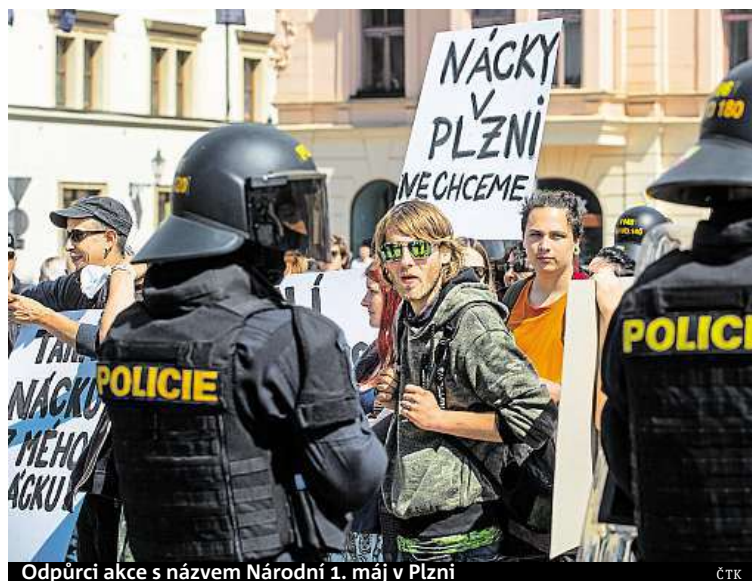
Odpůrci akce s názvem Národní 1. máj v Plzni ČTK

První máj se slavil také v Plzni. Tam dění ve městě ovládli stoupenci krajní pravice. Sešli se tam příznivci Dělnické strany sociální spravedlnosti (DSSS). Kromě nich na plzeňském náměstí demonstrovaly také občanské sdružení Dělnická mládež (DM) a pravicové protiislámské hnutí Blok proti islamizaci. Příznivců krajní pravice byly přibližně dvě stovky, jejich odpůrců zhruba padesát. Skupiny oddělovalo asi dvacet policistů. Odpůrci pravicových demonstrantů, kteří se