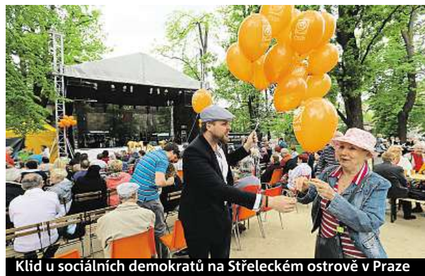
Klid u sociálních demokratů na Střeleckém ostrově v Praze