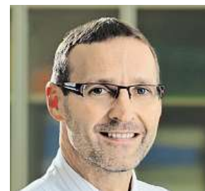
Pavel Jindra ARCHIV

„Ročně se v Česku provede přibližně 250 alogenních (od příbuzného či nepříbuzného dárce) transplantací krvetvorných buněk. Nedaří-li se najít vhodné dárce mezi sourozenci, hledáme mezi nepříbuzenskými dárci, kteří nepatrou část své kostní dřeně dobrovolně darují. Díky nim se může řada lidí vyléčit, za hodně jim vděčíme, i proto jim každoročně děkujeme na slavnostním Poděkování dárcům,“ doplňuje primář. Jedno takové se konalo ke konci