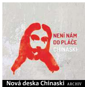
Nová deska Chinaski ARCHIV

Populární kapela ohlásila na podzim po koncertní pauze velké turné. Předzvěstí je desáté studiové album.