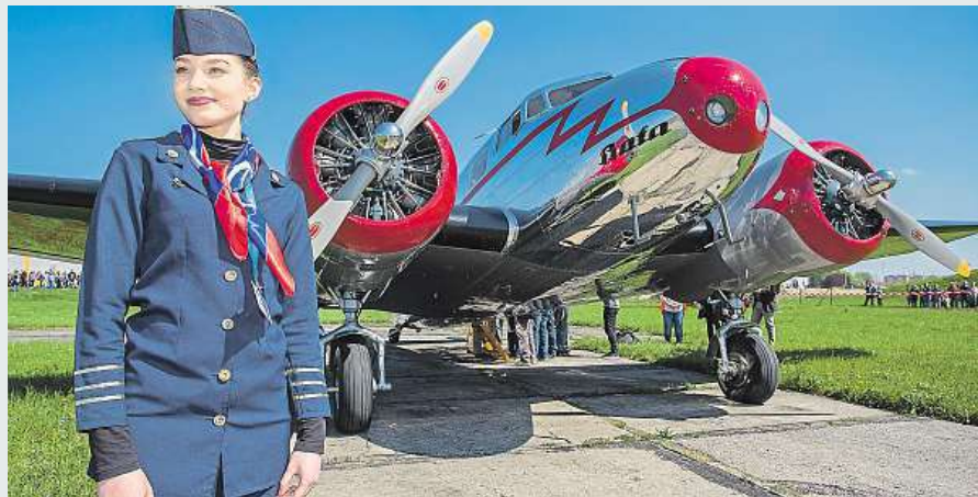
Historický letoun Electra, se kterým Baťa proletěl celý svět

Jízdenek a letenek na mistrovství světa v hokeji v Německu a Francii je stále dost. Autobusové společnosti jsou připraveny v případě nárůstu poptávky vypravit další spoje. Světový šampionát se v Paříži a Kolíně nad Rýnem uskuteční od 5. do 21. května. ČTK