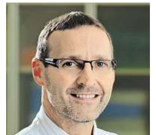
Pavel Jindra ARCHIV

„Ročně se v Česku provede přibližně 250 alogenních (od příbuzného či nepříbuzného dárce) transplantací krvetvorných buněk. Nedaří-li se najít vhodné dárce mezi sourozenci, hledáme mezi nepříbuzenskými dárce, kteří nepatrou část své kostní dřeně dobrovolně darují. Díky nim se může řada lidí vyléčit, za hodně jim vděčíme, i proto jim každoročně děkujeme na slavnostním Poděkování dárčům,“ doplňuje primář. Jedno takové se konalo ke konci