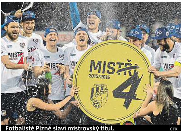
Fotbalisté Plzně slaví mistrovský titul.