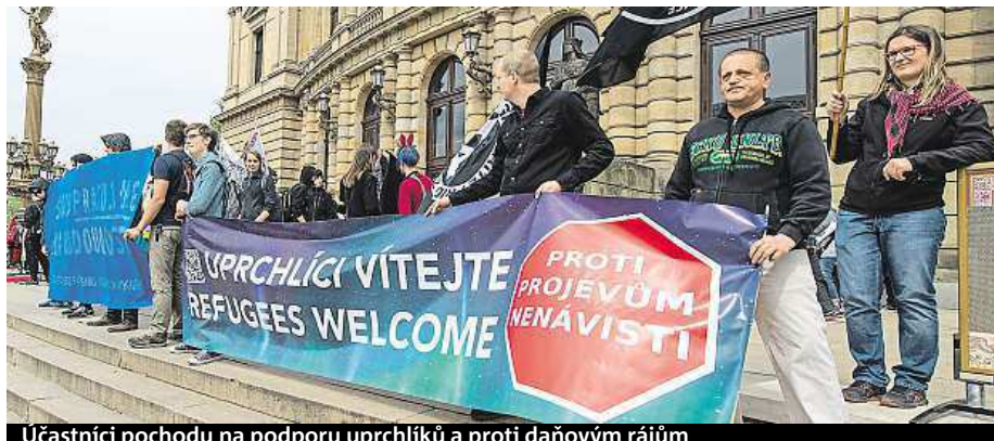
Účastníci pochodu na podporu uprchlíků a proti daňovým rájům

Vyškov: Sociální demokracie zde zveřejnila Prvomájový manifest, vystoupil s ním premiér a předseda Bohuslav Sobotka. V manifestu ČSSD navrhuje zvýšení tarifních platů lékařů a zdravotníků sester o 10 procent a navýšit se mají platy ve školství. čtk