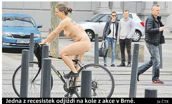
Jedna z recesistek odjíždí na kole z akce v Brně.