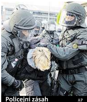
Policejní zásah

Program strany AfD mimo jiné požaduje, aby se zamezilo financování výstavby a provozu mešit prostřednictvím islámských zemí. Rovněž požaduje zákaz nošení burky. Delegáti nicméně odmítli zahrnout do prohlášení dodatek, podle kterého by všichni muslimové neměli být považováni za extremisty. Staví se také proti vstupu Turecka do EU. AfD v sobotu vystoupil bývalý český prezident Václav Klaus, jenž prohlásil, že „demonizaci“ AfD v německých politických a akademických kruzích i v médiích považuje za „absurdní“ a „lživou“. Podle průzkumů AfD podporuje až 14 procent voličů, což znamená vážnou hrozbu pro vládu Angely Merkelové. ČTK