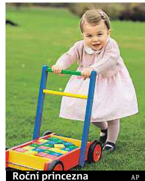
Roční princezna

Nové snímky britské princezny Charlotte publikoval včera britský královský dvůr při příležitosti jejich dnešních prvních narozenin. Princezna se narodila loni 2. května princovi Williamovi a jeho manželce Kate jako jejich druhorozené dítě. Jejím staršímu bratru Georgeovi budou v červenci dva roky. Obrázky urozeného batolety pořídila sama matka Kate. Nové fotografie zachycují Charlotte doma v Norfolku při hře na trávniku s vozíkem a kostkami. Dcera Williama a Kate se zatím na veřejnosti objevila jen jednou, a to při křtu. ČTK