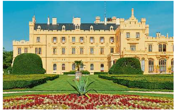
Lednicko-valtický areál zpřístupňuje turistům kromě rozlehlého parku několik památek.

Za návštěvu stojí také plzeňské Smetanovy sady, které byly mimochodem založeny roku 1820 osazením pevnostní plochy na západním obvodu města stromovím. Park má mimo jiné zajímavou sochařskou výzdobu. V roce 1925 zde byla odhalena socha Bedřicha Smetany, podle