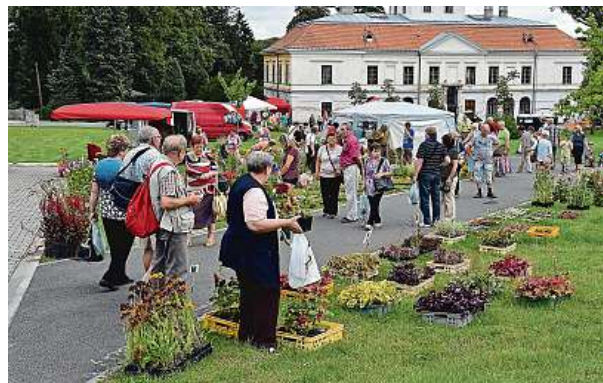
V zahradě Věžky je možné zakoupit si nějaké květiny i nářadí. Místní zahradníci připravují pro veřejnost nejrůznější odrůdy.

Dalším tipem na výlet za rozkvetlými stromy je zahrada u Horního Hradu nedaleko Stráže nad Ohří.