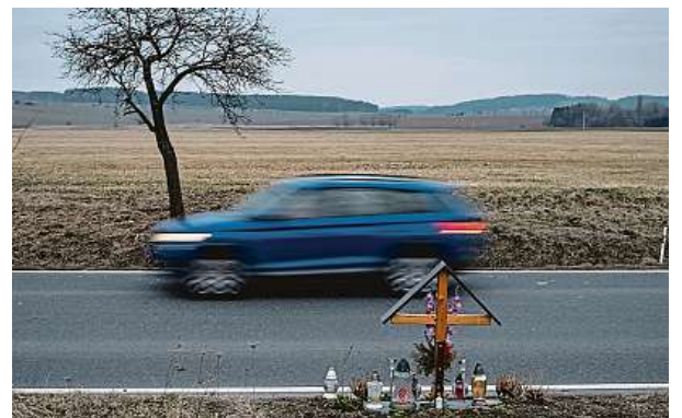
Před několika lety natočil Vít Klusák dokument 13 minut. Výpovědi řidičů, kteří měli naspěch a zavinili smrt. VÍT KLEMA

To je jen malý výběr obětí dopravních nehod, při nichž hrála roli vysoká rychlost. Ti lidé spěchali a stálo je to bohužel život. PAVEL HRABICA