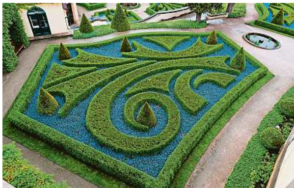
Vrtbovská zahrada je známá jako jedna z nejhezčích barokních zahrad v Praze.