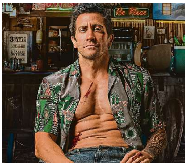
Osmdesátkový feeling nepřináší jen svítící neon v názvu snímku. Jake Gyllenhaal do toho opět dává všechno.

Než se rozepteší o tom, proč je nová Hrozba smrti zábavnou akční jednohubkou, je třeba se vrátit do roku 1989. Tehdy šlo do kin akční běčko s Patrickem Swayzem v hlavní roli zádumčivého barového coolera – šéfa partičky vyhazovačů, na kterého si jen tak někdo nepřijde. Což se hodí, vzhledem k faktu, že v jeho novém působišti bývá po ve-