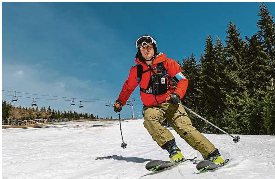
Velký rozdíl v délce zimní sezony byl mezi výše položenými horskými středisky a areály v podhůří. Propad tržeb byl citelný hlavně v podhorských areálech.

V Peci pod Sněžkou se sjezdovka Hnědý vrch uzavřela v první víkendový den. V neděli tam byla pro pěší v provozu už pouze jedna sedačková lanovka.