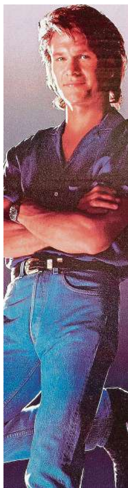
Patrick Swayze hraje v akční klasice chlápka, který udrží pořádek i v nejdivocejším nočním podniku.