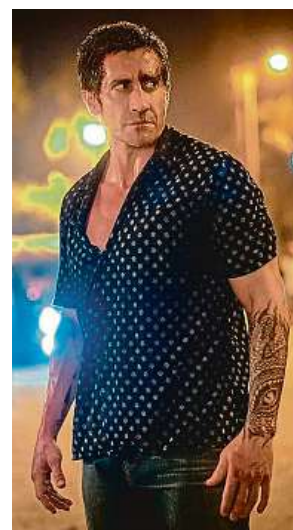
Ústřední hvězda nabrala kvůli roli kolem dvaceti kilo svalů.

Dalton se vrátil a je to pořad frajer! Tvůrci jedou podle šablony vyrobené úspěšnými