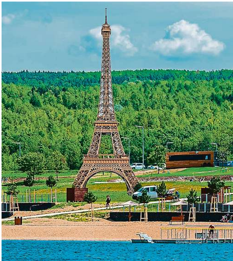
U jezera Most v Ústeckém kraji bude stát v létě během Olympijského festivalu zmenšená dvanáctimetrová replika pařížské Eiffelovy věže.