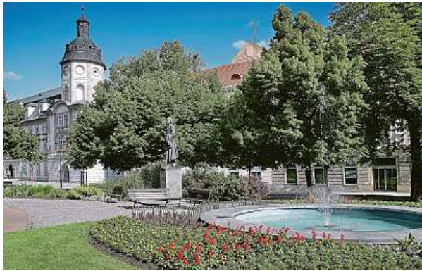
Mezi zajímavosti Smetanových sadů v Plzni patří jinan dvoulaločný – vývojově jeden z nejstarších druhů rostlin na světě.