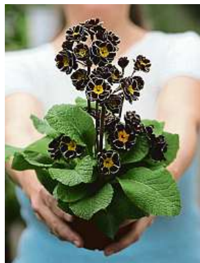
Botanická zahrada ukrývá řadu vzácných rostlin.