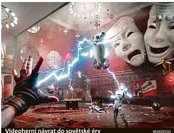
Videoherní návrat do sovětské éry

Od vydání ruské střílečky Atomic Heart už uplynul týden a emoce se vaří čím dál víc. „Kritikům se hra sice vesměs líbí, totéž lze říct i o prodejích,“ podotýká herní publicista Honza Srp, jenž rovnou upozorňuje, že „více než o nezpochybnitelných kvalitách hry se mluví o jejich vývojářích“. Inkriminované studio Mundfish je totiž sice oficiálně kyperské, ale jeho nejužší vedení tvoří výhradně Rusové. Ti se na svých sociálních sítích odmítají vyjádřit k probíhající válce, navíc svoji hru