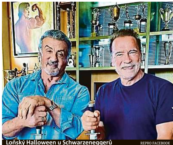
Loňský Halloween u Schwarzeneggerů