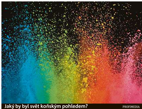
Jaký by byl svět koňským pohledem?

Naše křídla se vmžiku zvětší společně s našimi čelistmi, které dostanou tvar zobáku. Že jste si na začátku článku představili ptáka z rčení? Teď na to bohužel doplácíte. Ať chceme, nebo ne, je z nás majestátně vypadající sokol. Naše paleta barev se najednou zvětšila a na rozdíl od člo-