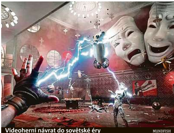
Videoherní návrat do sovětské éry

Od vydání ruské střílečky Atomic Heart už uplynul týden a emoce se vaří čím dál víc. „Kritikům se hra sice vesměs líbí, totéž lze říct i o prodejích,“ podotýká herní publicista Honza Srp, jenž rovnou upozorňuje, že „více než o nezpochybnitelných kvalitách hry se mluví o jejich vývojářích“. Inkriminované studio Mundfish je totiž sice oficiálně kyperské, ale jeho nejužší vedení tvoří výhradně Rusové. Ti se na svých sociálních sítích odmítají vyjádřit k probíhající válce, navíc svoji hru