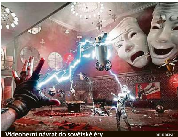
Videoherní návrat do sovětské éry

Od vydání ruské střílečky Atomic Heart už uplynul týden a emoce se vaří čím dál víc. „Kritikům se hra sice vesměs líbí, totéž lze říct i o prodejích,“ podotýká herní publicista Honza Šrp, jenž rovnou upozorňuje, že „více než o nezpochybnitelných kvalitách hry se mluví o jejich vývojářích“. Inkriminované studio Mundfish je totiž sice oficiálně kyperské, ale jeho nejužší vedení tvoří výhradně Rusové. Ti se na svých sociálních sítích odmítají vyjádřit k probíhající válce, navíc svoji hru