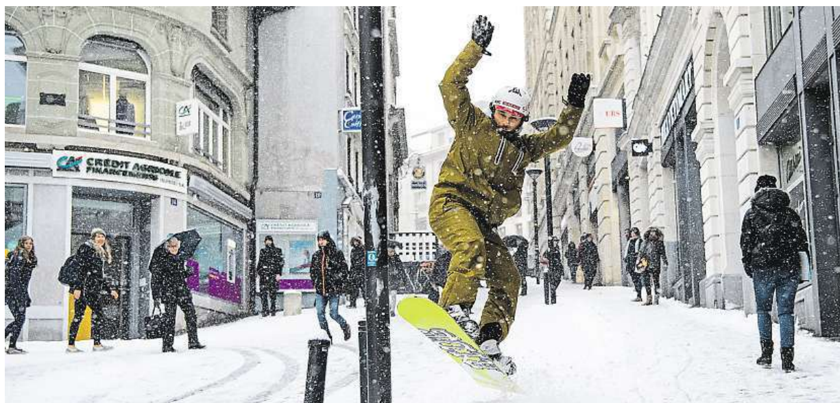
Ve švýcarském Lausanne včera snowboardisté vybalili prkna přímo mezi chodci v ulicích.

Rodiče. Mnohdy nemají potuchy, co jejich potomci dělají na internetu. Sociální síť. Účty si na nich zakládají příliš mladí uživatelé. Hrozba kyberšikany. Děti jsou lehkovážné, málo si chrání soukromí STRANA 6