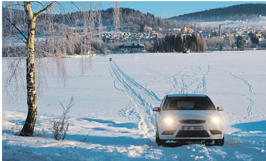
Už několik let si řidiči zkracují cestu přes zamrzlé Lipno (snímek je z roku 2010).