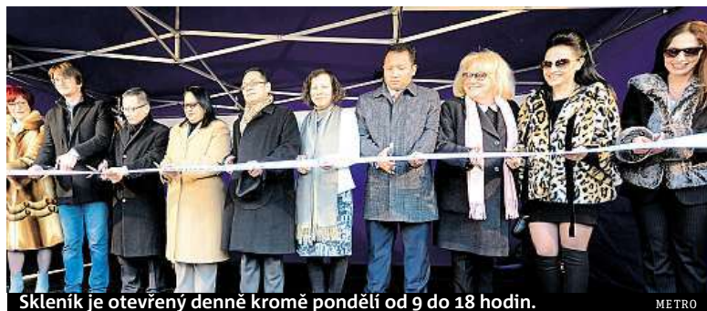
Skleník je otevřený denně kromě pondělí od 9 do 18 hodin. METRO

Velvyslanec Thajska Narong Sasitorn pro deník Metro uvedl, že orchideje jsou pro jeho zemi velmi významnou hospodářskou rostlinou. „Jsme předním vývozcem orchidejí ve světě. Jsou také dobrým prostředkem pro navazování přátelství a pro budování povědomí o významu přírody,“ upozornil velvyslanec. Thajská ambasáda zapůjčila sochy a dekorativní předměty včetně tradičních slunečniců. Tyto předměty stojí hned u vchodu na výstavu. PUR