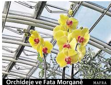
Orchideje ve Fata Morgané MAFRA