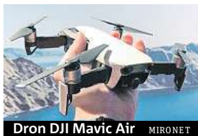
Dron DJI Mavic Air MIRONET

Mezi nejznámější a zároveň nejprodávanější drony patří DJI, které v Česku prodává například náš největší IT e-shop Mironet. Z pestré nabídky DJI si vyberou jak zkušenostní uživatelé, kteří si