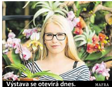
Výstava se otevírá dnes.

Výstava orchidejí potrvá v trojské botanické zahradě až do 25. března.