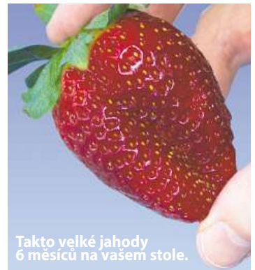
Takto velké jahody 6 měsíců na vašem stole.

Ano, nyní se již nepotřebujete ohýbat, abyste sbírali na zemi a v blátě jahody, které napadli živočišové ještě předtím, než byly zralé.