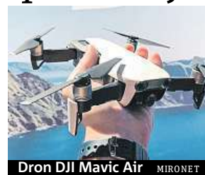
Dron DJI Mavic Air MIRONET

Dron lze ovládat přes vysílač, mobil či pomocí gest. Na jeden akumulátor dokáže létat až 21 minut a dosáhnout maximální rychlosti 68,4 km/h. Pak vás oslní záběry z výšky až pět kilometrů.