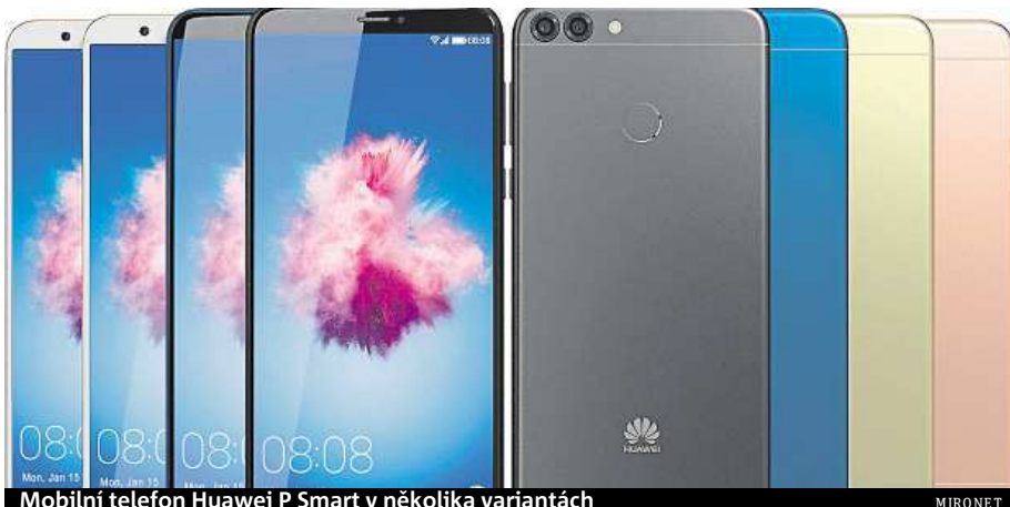
Mobilní telefon Huawei P Smart v několika variantách

Huawei P Smart zaujme pevným kovovým šasi a parádním 5,65" FullView displejem s tenkými rámečky a rozlišením 2160 x 1080 px. O hladký chod nejnovějšího Androidu 8.0 Oreo se stará vý-