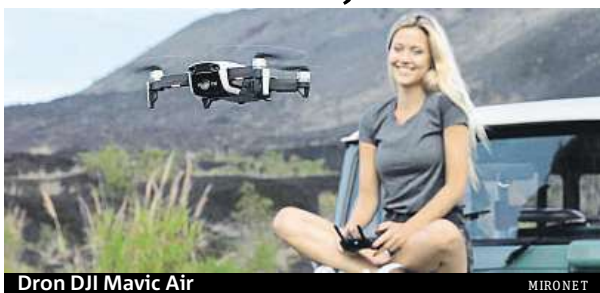
Dron DJI Mavic Air

Mezi nejznámější a zároveň nejprodávanější drony patří DJI, které v Česku prodává například náš největší IT e-shop Mironet. Z pestré nabídky DJI si vyberou jak příležitostní uživatelé, kteří si