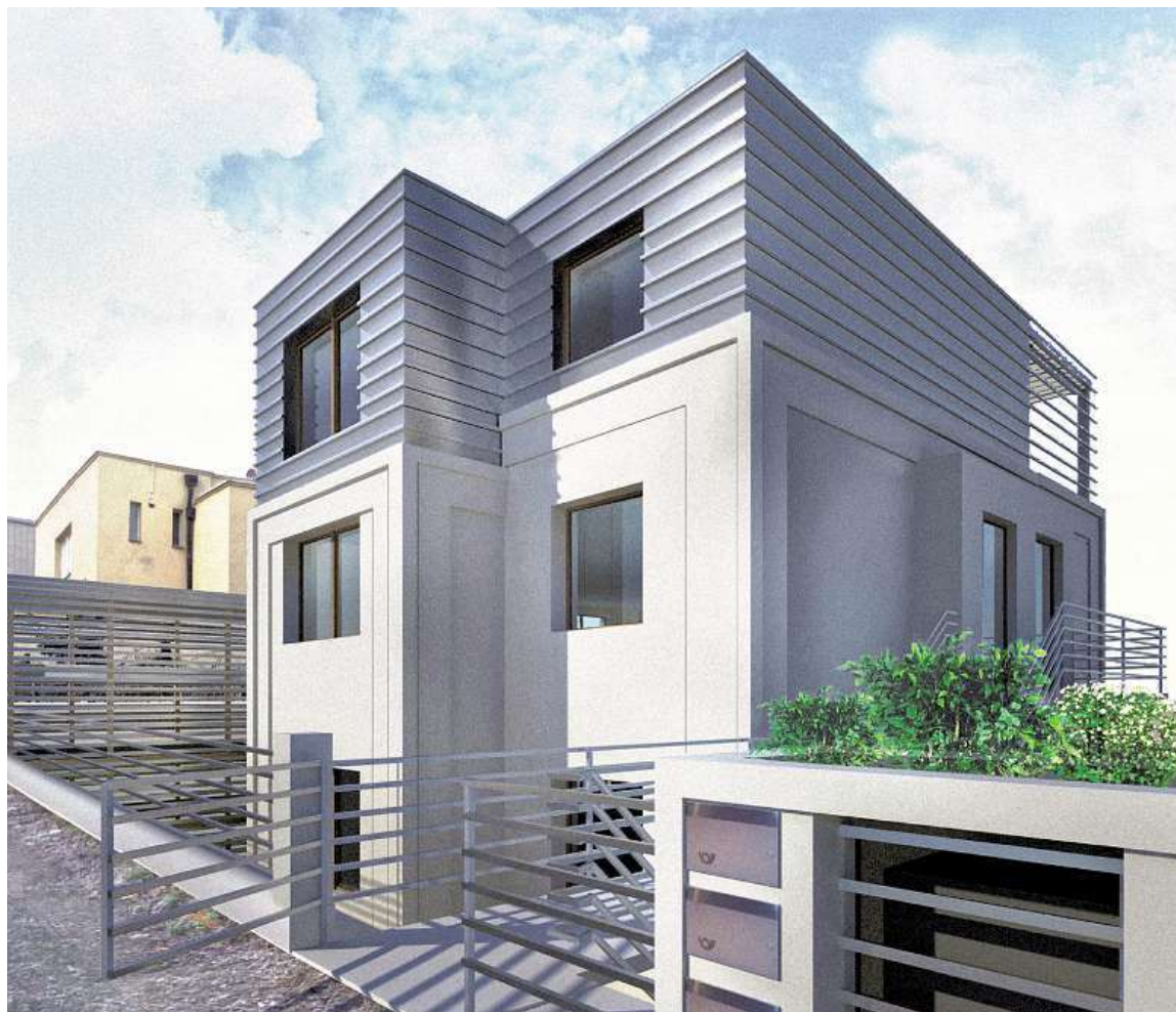
Vizualizace: Mooza Architecture Text: Jan Cech

V místě mezi domem a opěrnou zdí vzniká další prostor, který se dá využít pro společenský život obyvatel domu. Například jako letní kino. Jako filmové plátno poslouží stěna garáže se zakládačem pro dvě auta, která elegantně vyřeší situaci s nedostatkem místa pro velkou garáž i výškový rozdíl terénu. „Jednu fasádu domu jsme pojednali jako lezeckou stěnu, které reflektuje zálibu majitele v lezení. S trochou nadsázky může tak domů chodit různým způsobem,“ dodává s úsměvem Klára Císařovská.