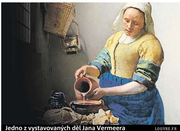
Jedno z vystavovaných děl Jana Vermeera

Kvůli mimořádně dlouhým frontám hned od zahájení výstavy minulou středu a četným stížnostem návštěvníků zavedlo muzeum poprvé povinnou rezervaci vstupního „okénka“. Událost nazvaná Vermeer a mistři žánrové malby nabízí jedinečnou příležitost vidět pohromadě dvánáct nejzákladnějších Vermeerových obrazů a podle časopisu Forbes bývá označována za „výstavu roku“.