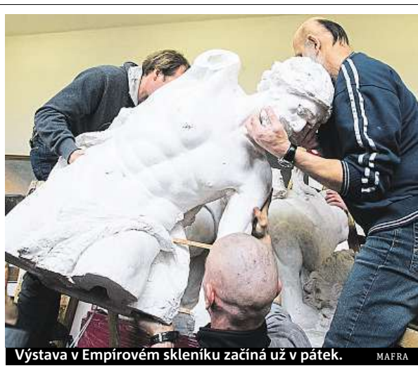
Výstava v Empírovém skleníku začíná už v pátek.

chotěm, císařem Františkem I. Štěpánem Lotrinským v doprovodu rodiny a dvořanů.