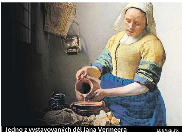
Jedno z vystavovaných děl Jana Vermeera

Kvůli mimořádně dlouhým frontám hned od zahájení výstavy minulou středu a četným stížnostem návštěvníků zavedlo muzeum poprvé povinnou rezervaci vstupního „okénka“. Událost nazvaná Vermeer a mistři žánrové malby nabízí jedinečnou příležitost vidět pohromadě dvacet nejzajímavějších Vermeerových obrazů a podle časopisu Forbes bývá označována za „výstavu roku“.