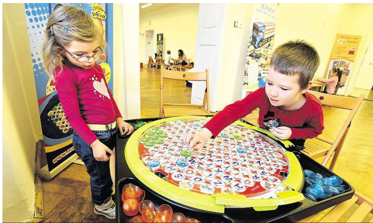
Celý březen potrvá na zámku Zlín Festival IQ Play. Děti si vyzkouší například smyslové hračky, logické hry nebo stavebnice. ČTK

Elektronická evidence tržeb. Prodejci papírových kotoučků do pokladen jsou spokojeni. Obsah paragonu. Povinné údaje se od včera týkají třeba i trafik a večerek. Úspory. Obchodníci chtějí účtenky co nejmenší STRANA 2