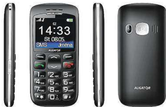
Velmi lehký a ergonomicky tvarovaný telefon MIRONET

Vzali jsme si dnes na paškál typického zástupce této skupiny, model Aligator A670 Senior. Velmi lehký a ergonomicky tvarovaný telefon se po konstrukční stránce může pochlubit 2,2" přehledným barevným displejem a velkými tlačítky pro co nejpříjemnější ovládní. Nechybí ani velmi praktické SOS tlačítko, které v případě nouze odešle SMS zprávu vybraným kontaktům. Funkce SOS Locator navíc do zprávy přidá infor-