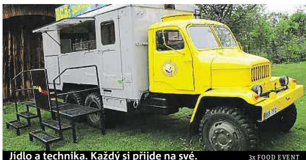
Jídlo a technika. Každý si přijde na své.