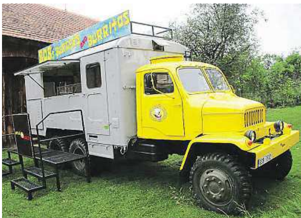
Jídlo a technika. Každý si přijde na své.

Snažíme se sledovat celosvětové gastronomické trendy, inspirovat se v zahraničí a vymýšlet vlastní nová témata festivalů. Například námi pořádány Asia Food Fest, který se konal loni na podzim, měl ukázat lidem, že asijskou kuchyni nezastupuje pouze Čína, Thajsko nebo Vietnam, ale že do Asie spadá dalších více než 40 zemí. V letošním roce jsme zařadili mezinárodní přehlídku food trucků.