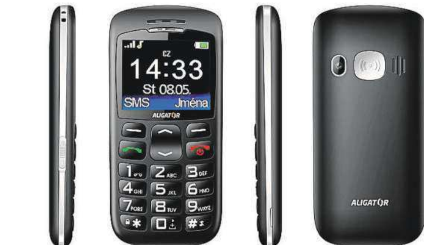
Velmi lehký a ergonomicky tvarovaný telefon

Vzali jsme si dnes na paškál typického zástupce této skupiny, model Aligator A670 Senior. Velmi lehký a ergonomicky tvarovaný telefon se po konstrukční stránce může pochlubit 2,2" přehledným barevným displejem a velkými tlačítky pro co nejpříjemnější ovládní. Nechybí ani velmi praktické SOS tlačítko, které v případě nouze odešle SMS zprávu vybraným kontaktům. Funkce SOS Locator navíc do zprávy přidá informace o polo-